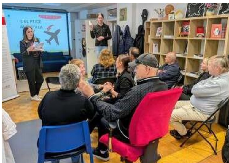
Ko besede oživijo