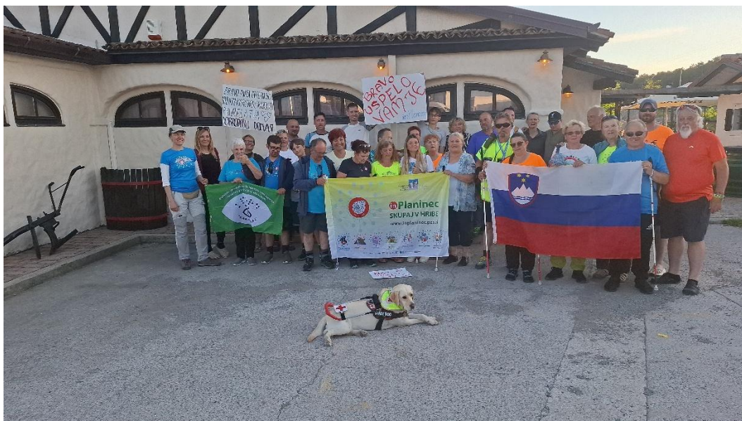
Camino ni bil le športni ali pohodniški izziv