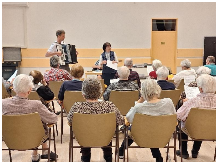
Sodelovanje pri pevskih vajah