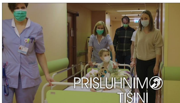
Zdravilo Urbagen končno dobilo zeleno luč