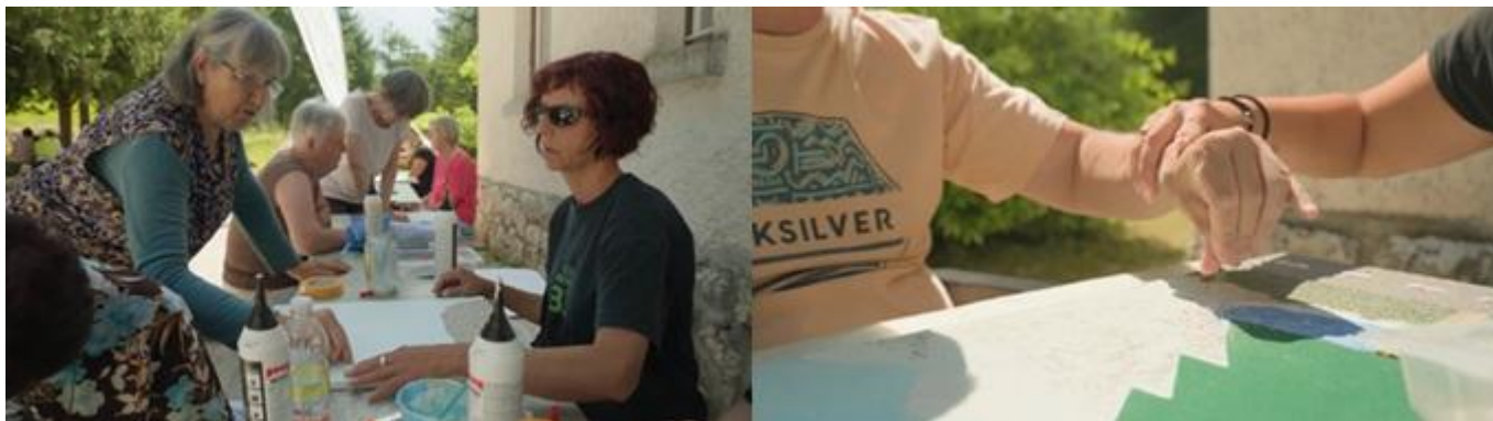
Likovna delavnica društva MDSS Nova Gorica