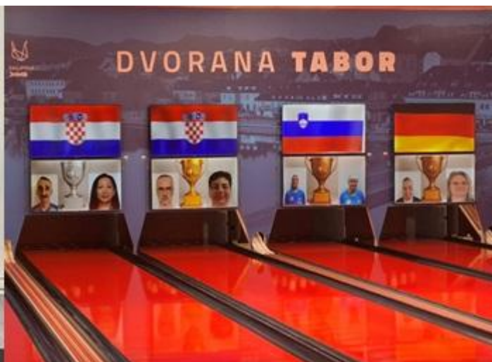
4. Evropsko prvenstvo gluhih v kegljanju v Mariboru