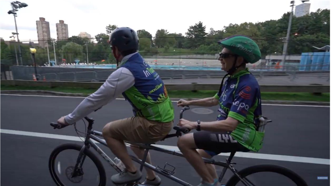
Tandem kolo za slepe in slabovidne