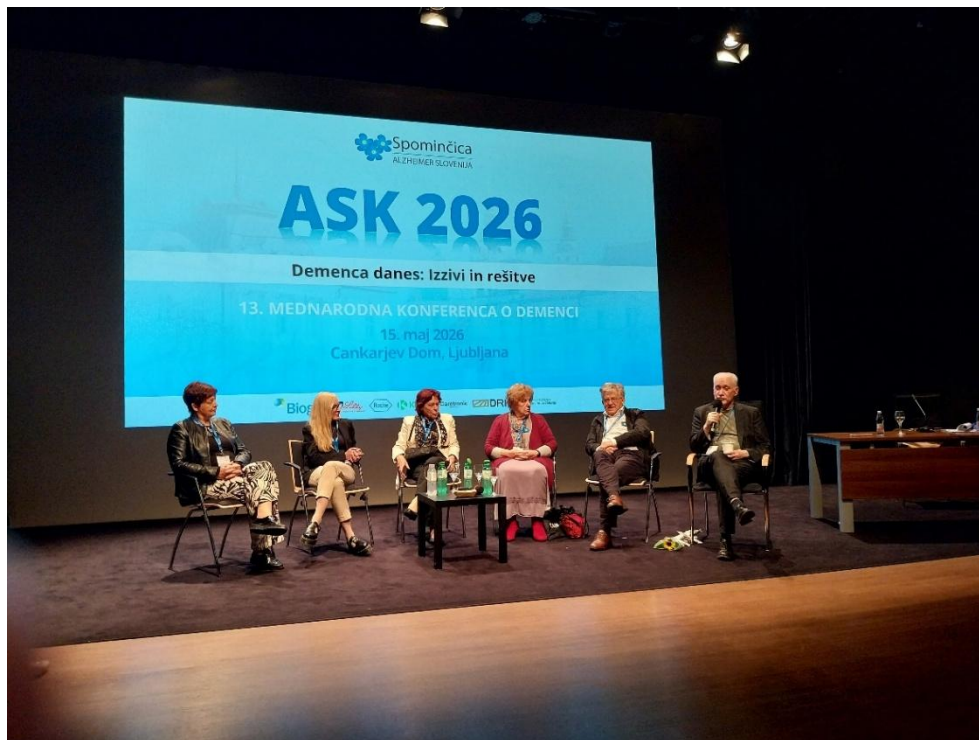
Mednarodna konferenca o demenci ASK 2026