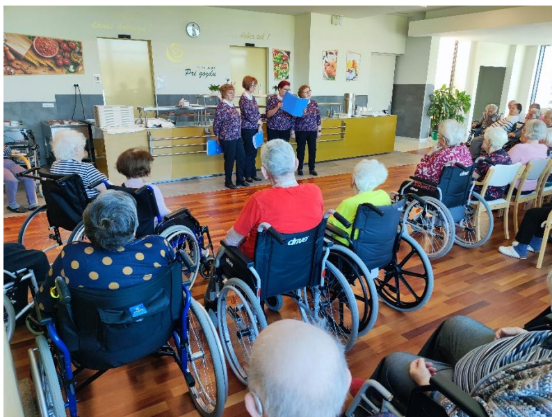
Pevsko obarvani dan v Juršincih