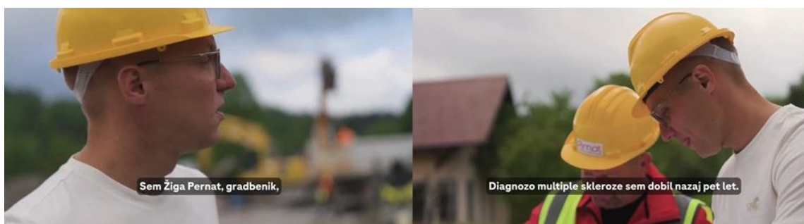
»Ne smeš se ustaviti, ne smeš obupati. To je najbolj važno.« - Žiga Pirnat