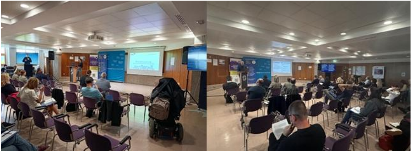
Dogodek, namenjen ozaveščanju o pomenu digitalne dostopnosti