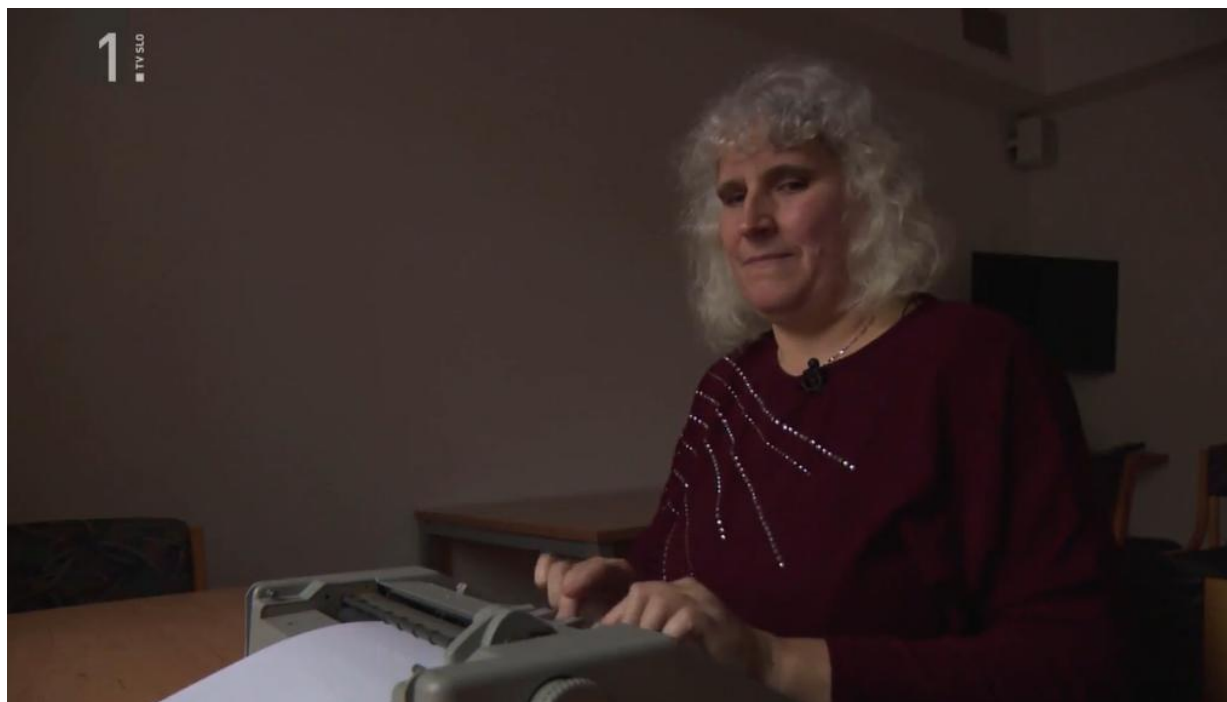
Začenja se teden slepih in slabovidnih. Prispevek iz oddaje Prvi dnevnik (4.1.2026)