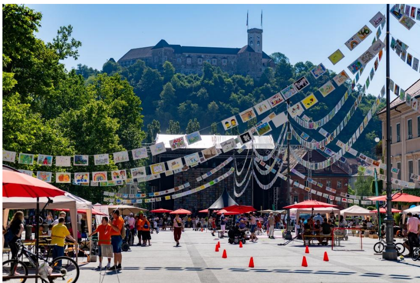
Festival, ki poteka v središču Ljubljane