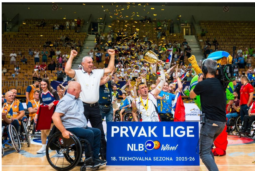
Slavje v Hali Tivoli