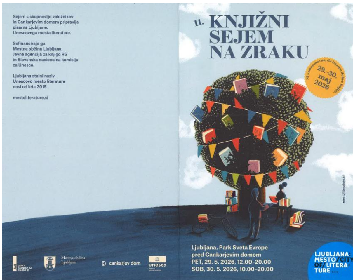
Letak - 11. Knjižni sejem na zraku