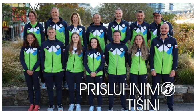
Slovenska ekipa gluhih športnikov