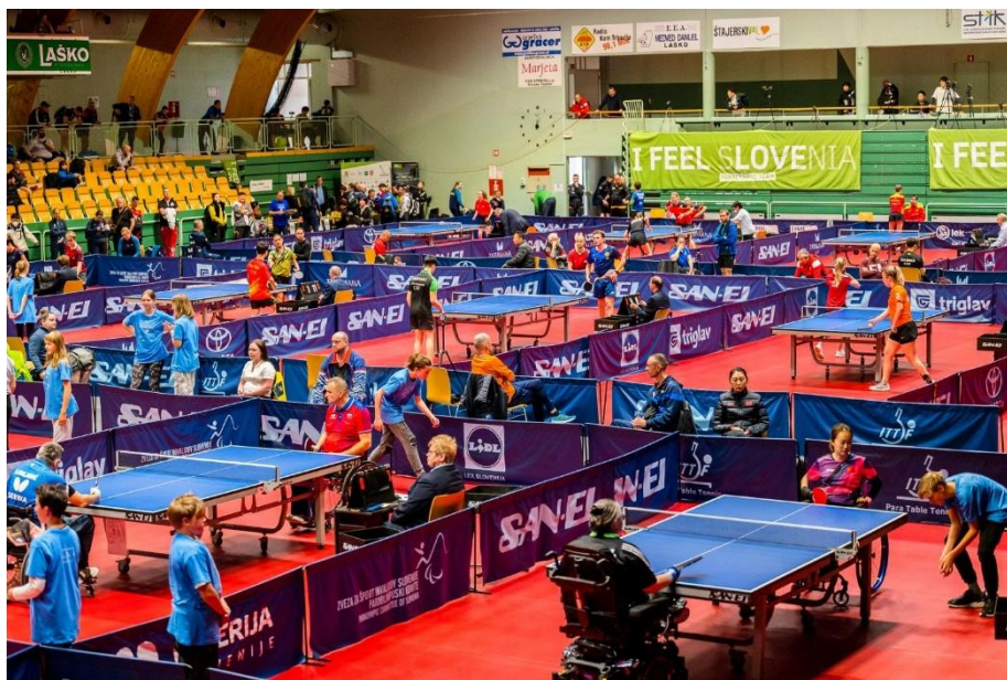
Turnir v Laškem