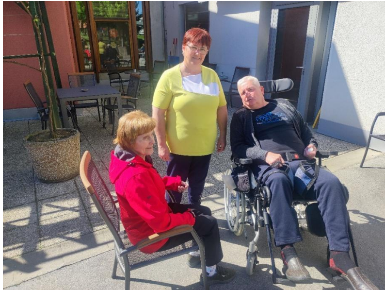
Obisk in pogovor na toplen soncu v Ormožu