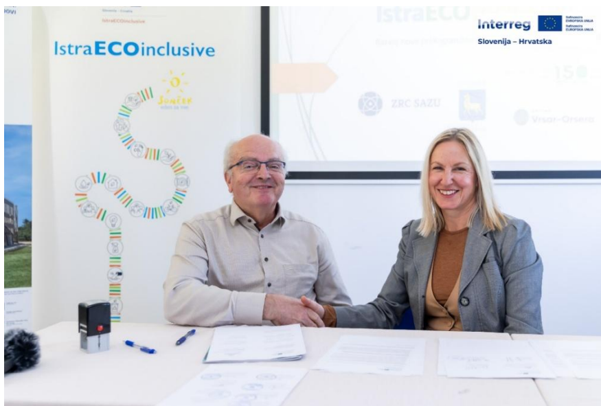
Zveza Sonček kot partner v projektu IstraECOinclusive