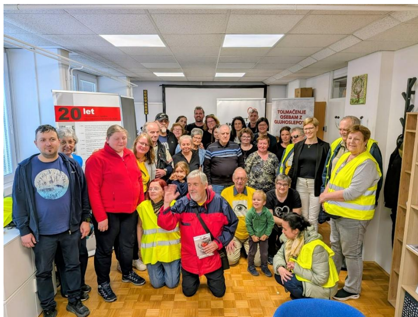
Obisk iz Avstrije