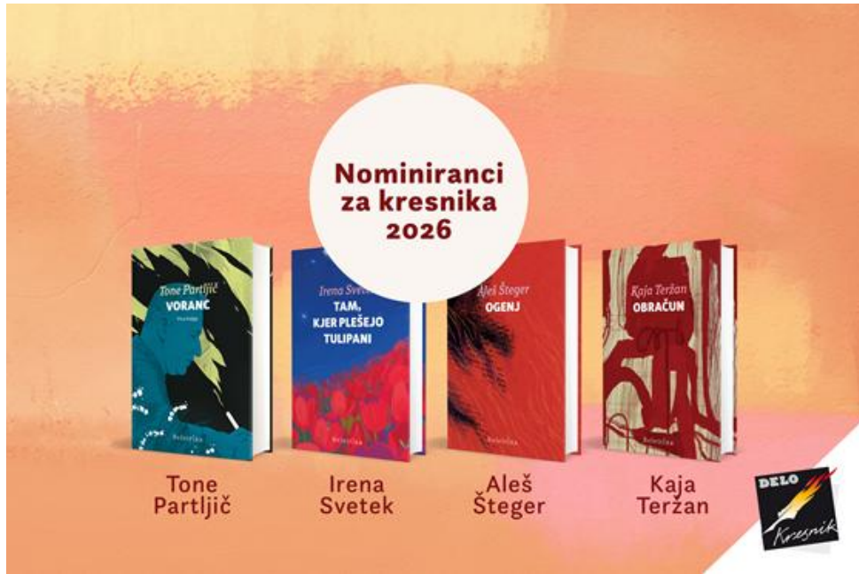
Nominiranci za kresnika 2026