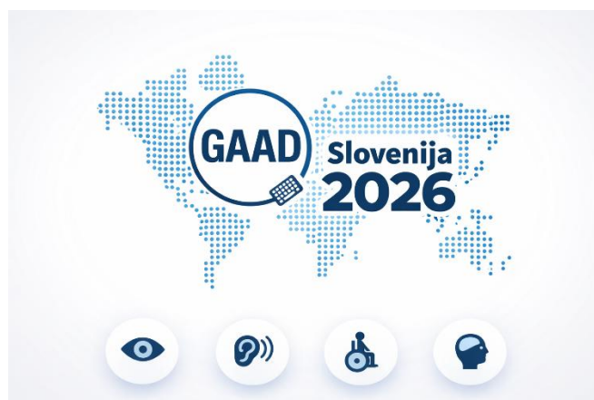
Vabljeni na brezplačno konferenco