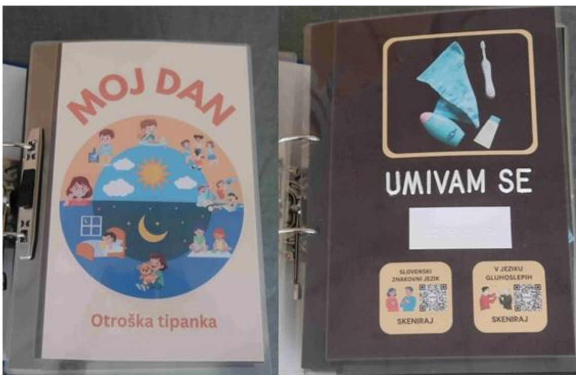
Prva edinstvena otroška tipanka »Moja dan«