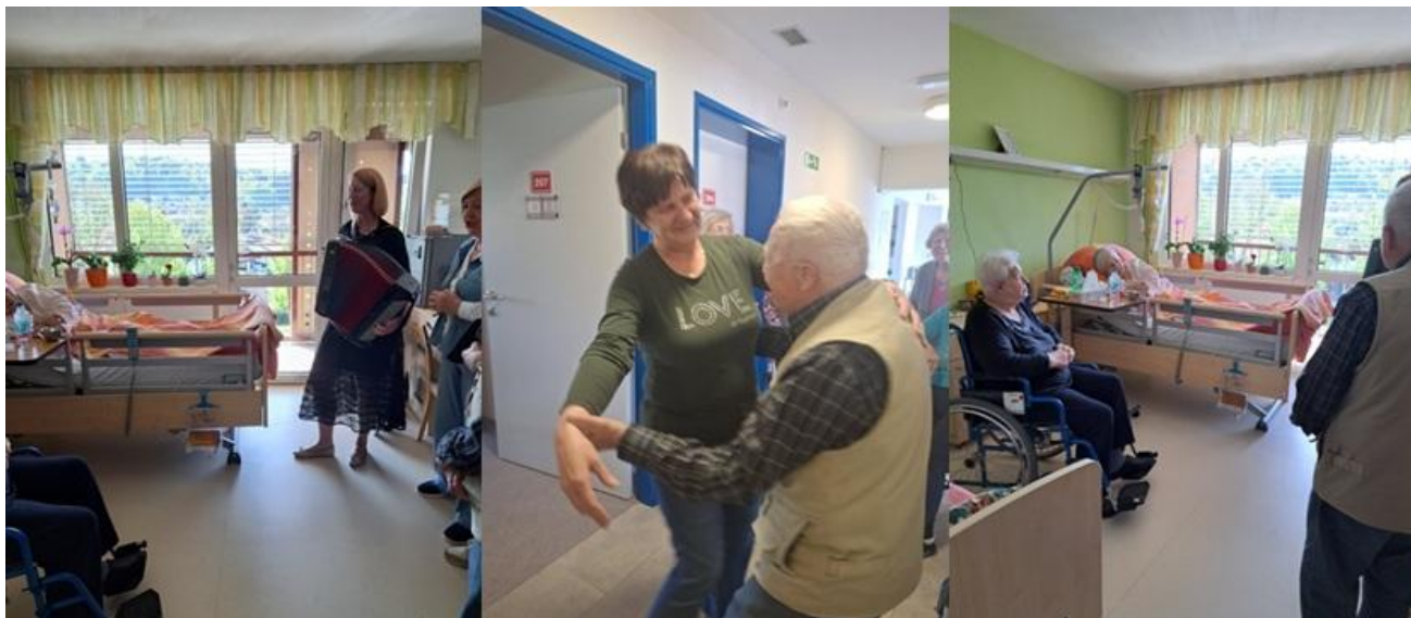
Veselo je bilo v Grosupljem