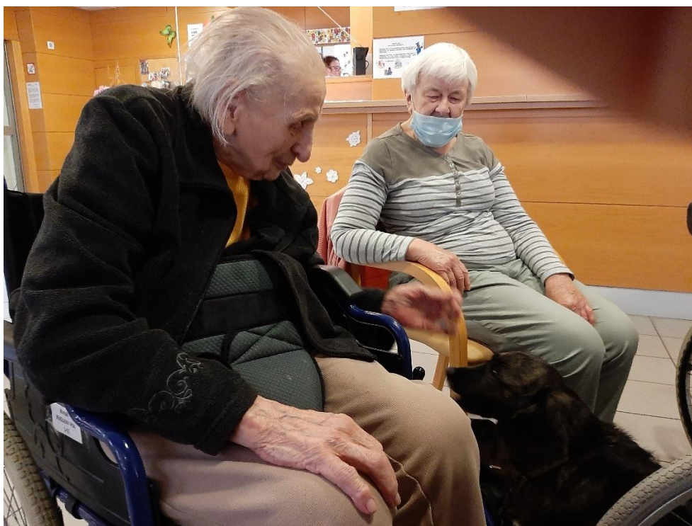
Terapije s pomočjo psov