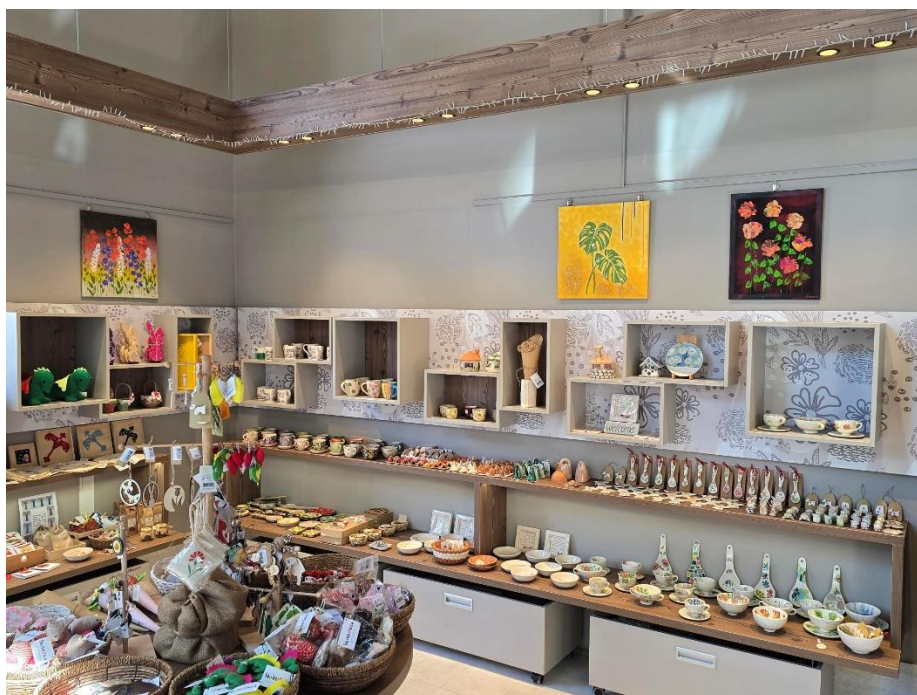
Odprtje razstave »Prinesi mi rože«