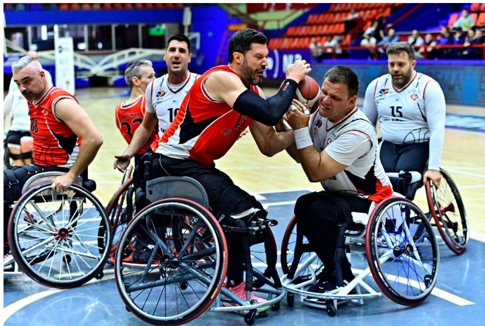
Polfinale turnirja v Banja Luki