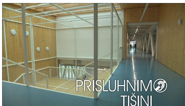
Poklicna okvara sluha