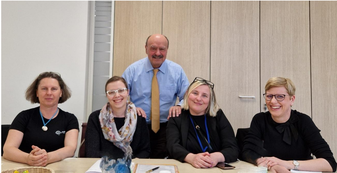
Kako pomembno je delo za osebe z gluhoslepoto in druge skupine ljudi