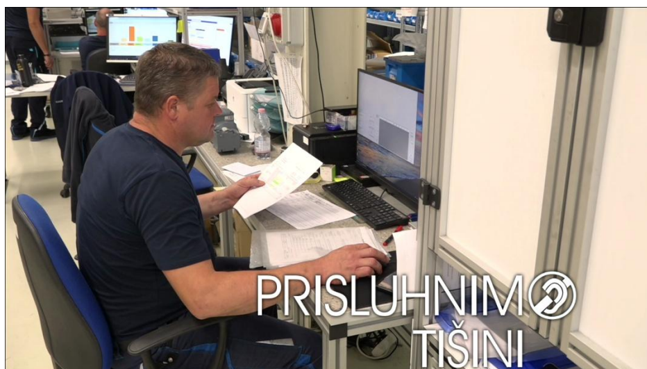
Zgodbe gluhih zaposlenih