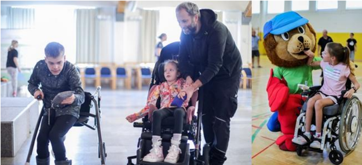
Mladi vključeni v parašport