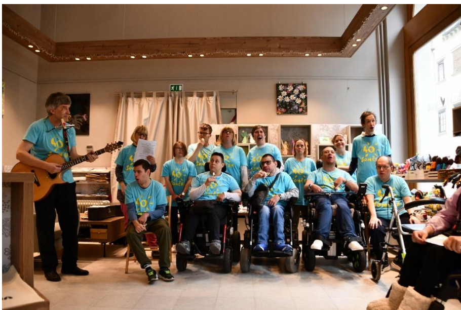
Sončkov pevski zbor