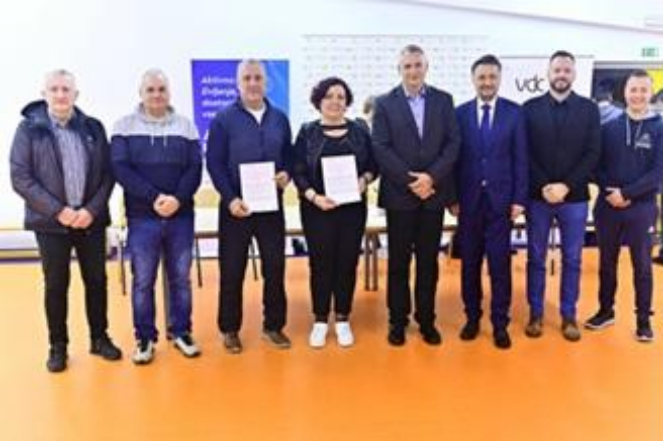
Predstavitve projekta Aktivno inkluzivno v regiji Zasavje