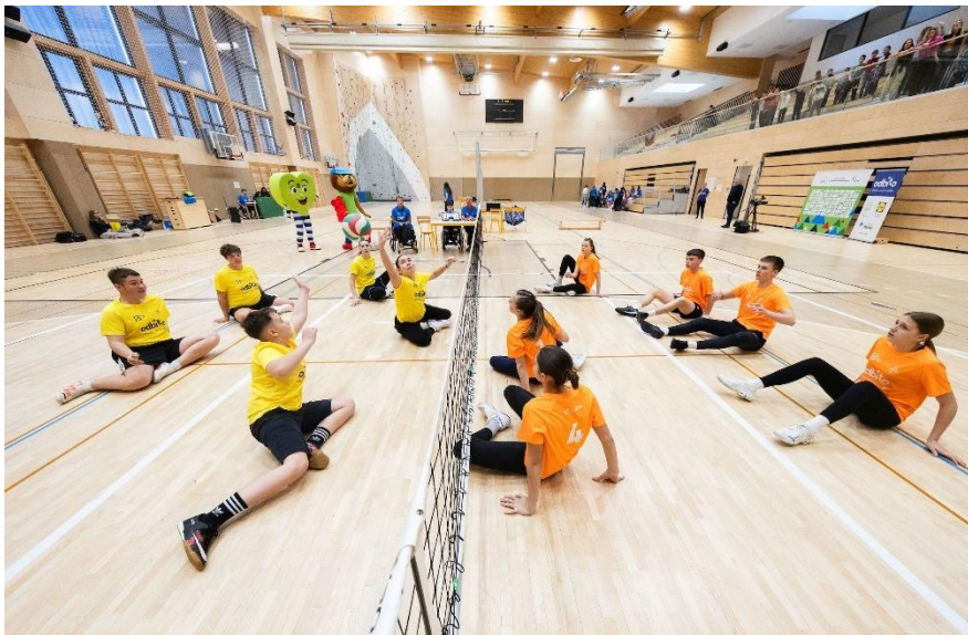
Utrinek iz lanskoletnega finala v Štorah