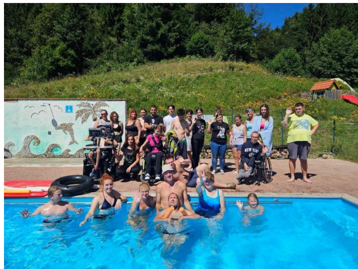
Poletje s Sončkom