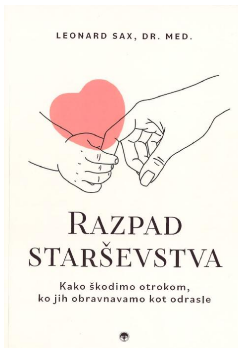
Založba Primus, strani 282, 29,00 eur