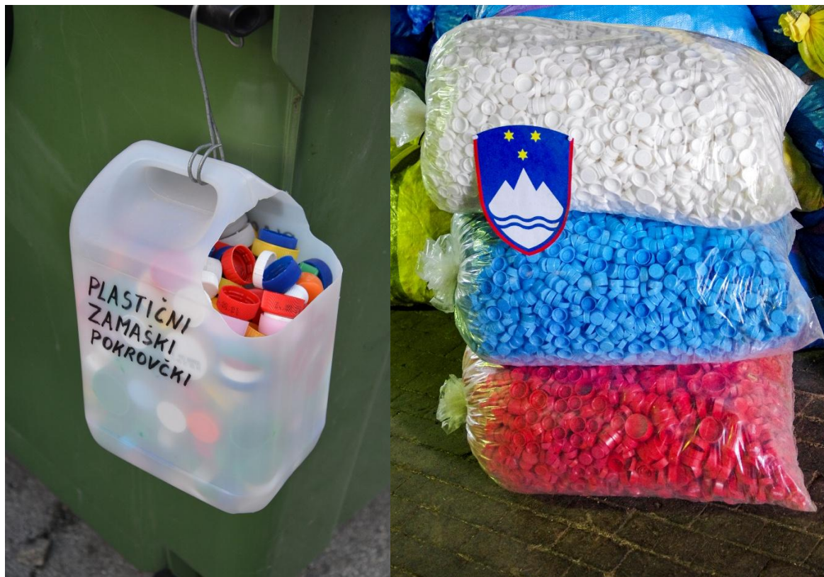
Še naprej bo potrebno zbirati zamaške za ranljivo otroško populacijo

Sicer pa vemo, kako dela naša birokracija in razne politične zveze in povezave stvar še kar nekaj časa po mojem laičnem prepričanju ne bo zaživela v praksi, ampak ti otroci potrebujejo pomoč sedaj in takoj.