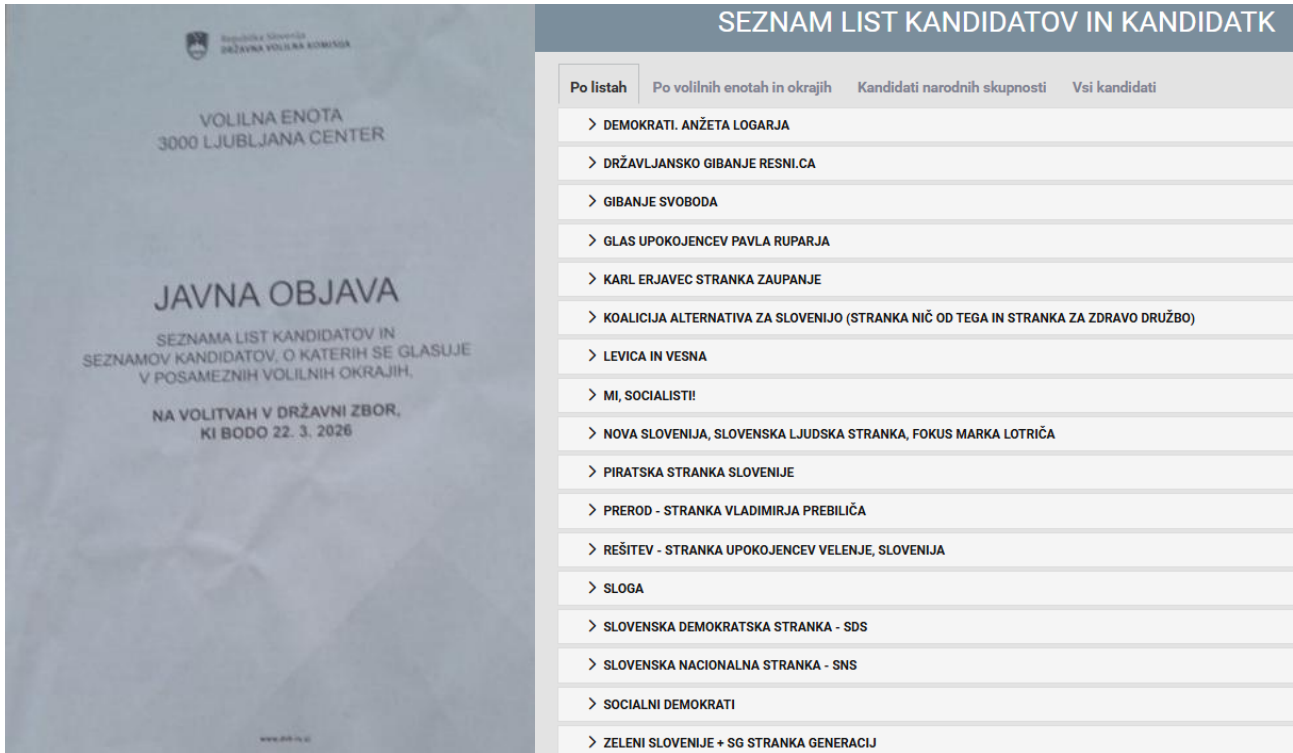
Volitve v Državni zbor 2026