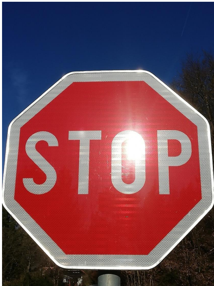
Stop spornemu oglaševanju slušnih ojačevalcev Foto: Boris Horvat Tihi

Sporno oglaševanje slušnih ojačevalcev , je po sklepu Programskega odbora za problematiko programskih vsebin za invalide na RTV Slovenija, trajno umaknjeno iz produkcije RTV Slovenija. Takšna skupna in soglasna odločitev vseh prisotnih, je zagotovo tudi rezultat številnih objavljenih člankov predstavnikov uporabnikov z izgubo sluha, javno objavljenih mnenj uradne zdravniške stroke in dobaviteljev slušnih aparatov s koncesijo ZZZS, nenazadnje tudi našega uradnega protestnega pisma, mnenja specialistov ORL, Javne agencije RS za zdravila in medicinske pripomočke in vseh ostalih sodelujočih, med drugim tudi uredništva Sporočevalca, ki enotno nasprotujemo škodljivemu in zavajajočemu oglaševanju nepreverjenih slušnih ojačevalcev.