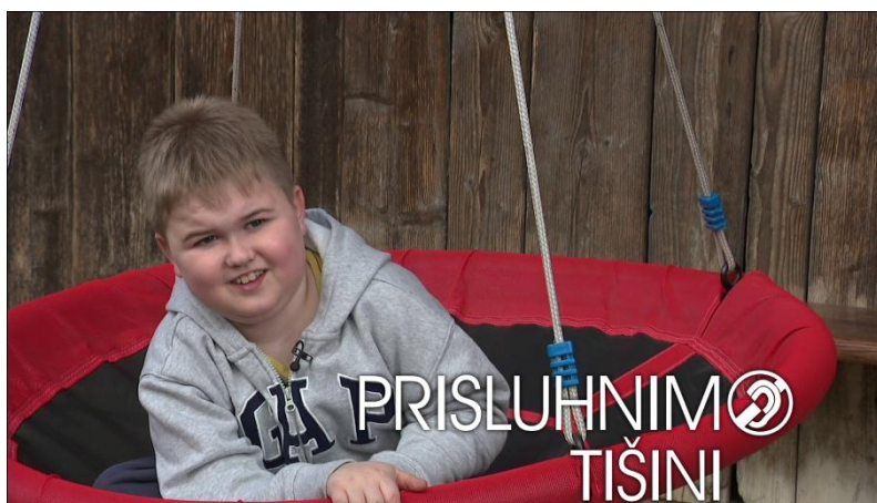
Jakova bitka s časom