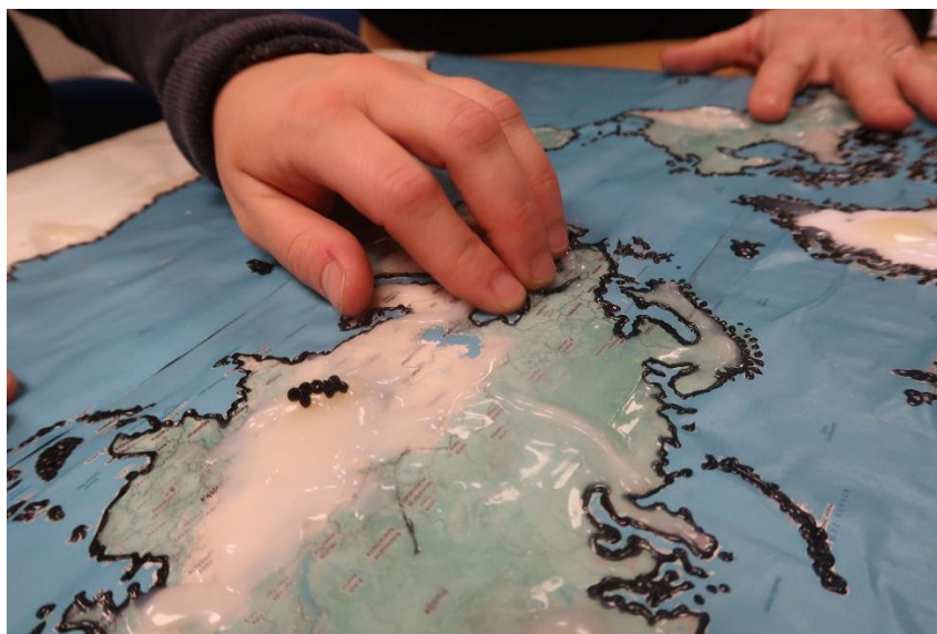
Taktilni pripomoček – zemljevid sveta