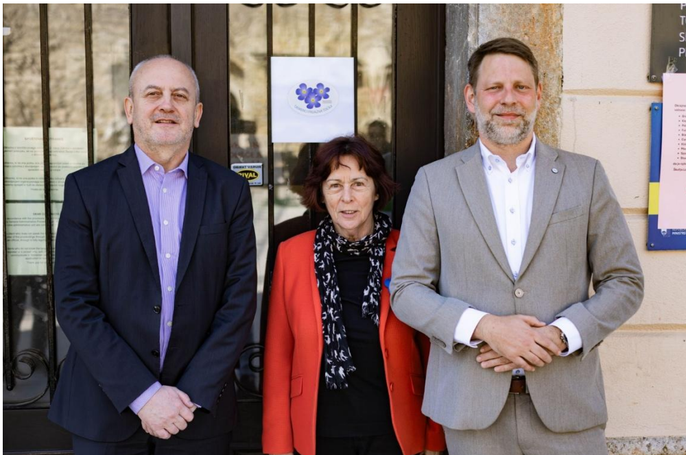
Upravna enota Škofja Loka je postala Demenci prijazna točka