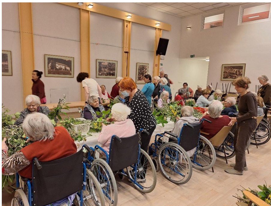
Izdelovali so cvetne butarice