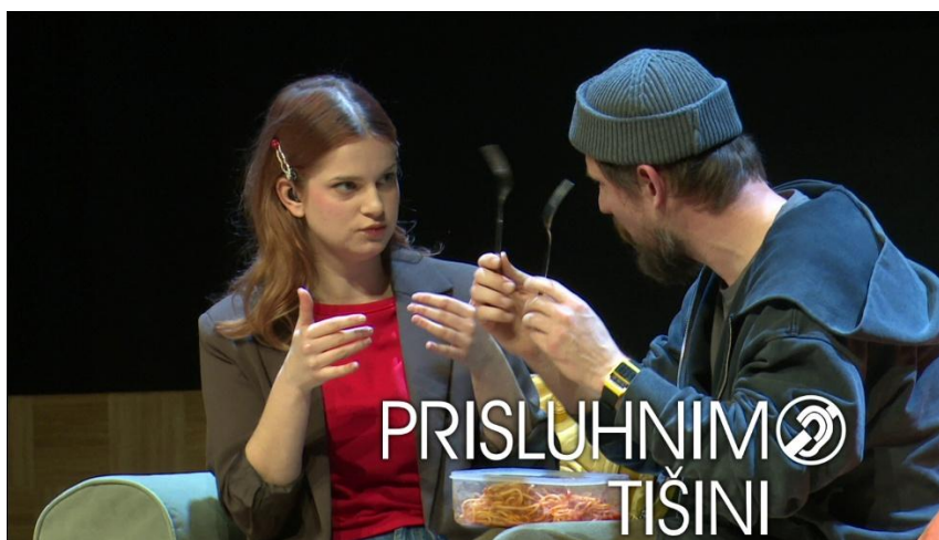
Predstava »100 pa roka!«