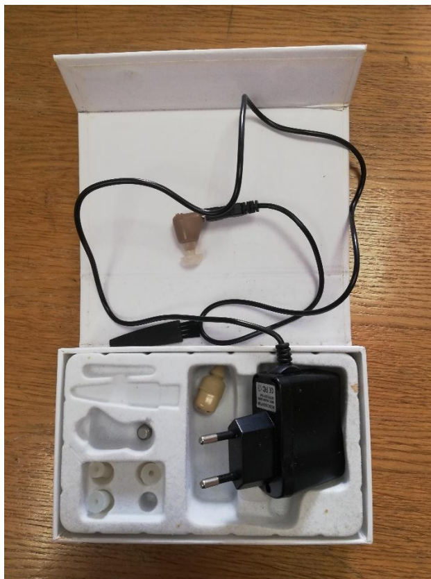
Neustrezni slušni pripomoček