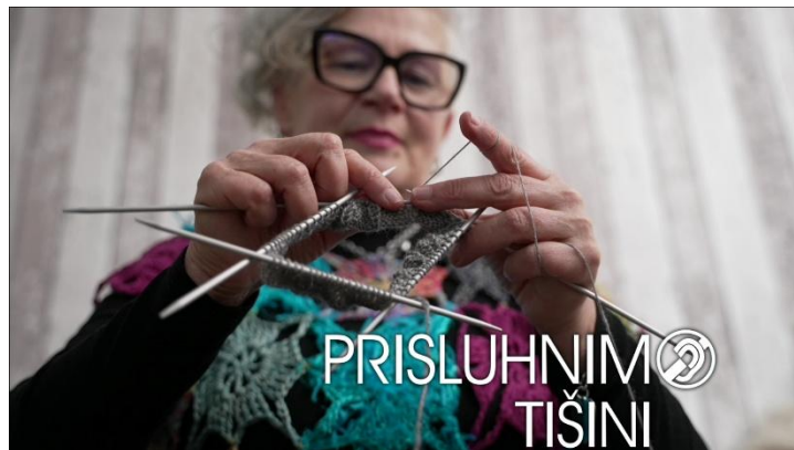
Andreja svojo zgodbo plete z volnenimi nitmi