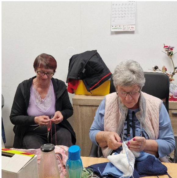
Velikonočno druženje v prostorih Čebelce v Vojniku