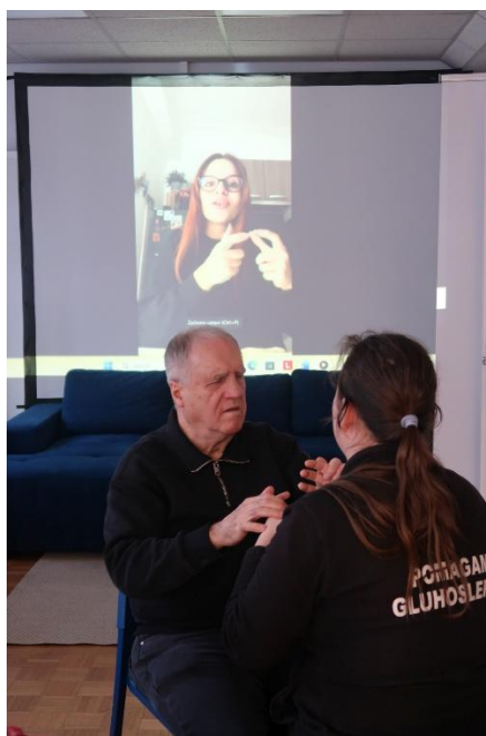
Dlan bere 2