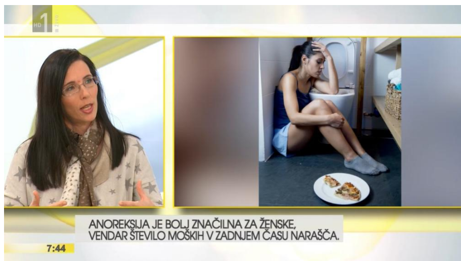
Prispevek iz oddaje Dobro jutro: Svetujemo: anoreksija (31.1.2019)