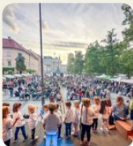
Dva večerna koncerta