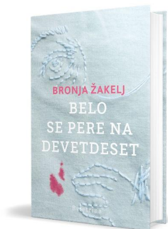
Knjižna uspešnica

V Knjižnici slepih in slabovidnih Minke Skaberne bomo gostili eno najprepoznavnejših sodobnih slovenskih pisateljic Bronjo Žakelj , avtorico nagrajenega romana Belo se pere na devetdeset . Dogodek bo potekal v torek, 5. maja 2026, ob 9.30.