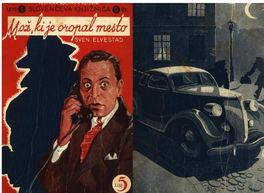
Konzorcij »Slovenca«, strani 147