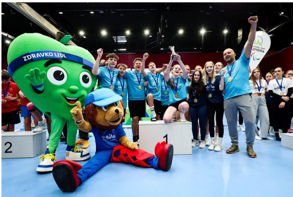
Prvaki OŠ Šempeter v Savinjski dolini