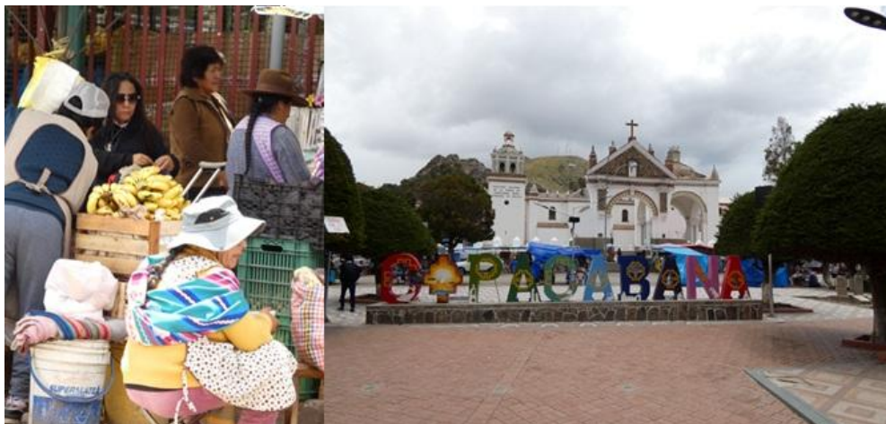
Potovanje po Peruju in Boliviji

Še eno znamenitost Peruja je treba omeniti – pristanek vesoljcev. To si je vbil v glavo znani švicarski pisatelj Erich von Däniken, ki je letos januarja umrl. Razvil je teorijo o nezemeljskem oziroma vesoljskem izvoru starodavnih civilizacij. V puščavah Peruja je odkril ravne črte, v delu Peruja pa prebivalce z podaljšanimi lobanjami. Oboje je seveda pripisal vesoljcem, čeprav so bile ravne črte po puščavi verjetno karavanske poti, podaljšane lobanje pa rezultat prakse, da so dojenčkom in malim otrokom ob glavico vezali lesene obloge.