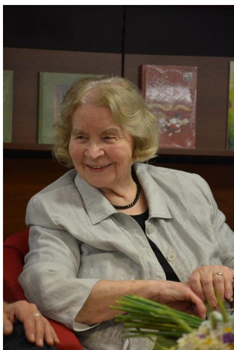
Slovo velike ilustratorke in slikarke