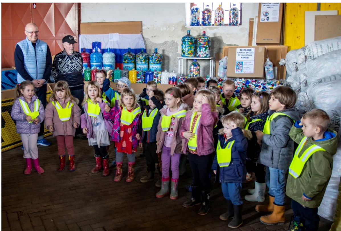
Varovanci Ptujškega vrtca Marjetica