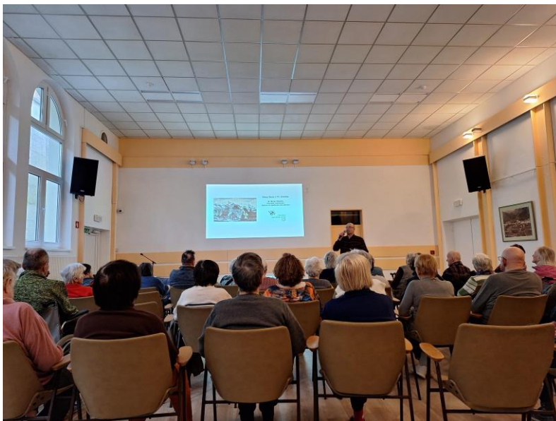
Na predavanju na Jesenicah