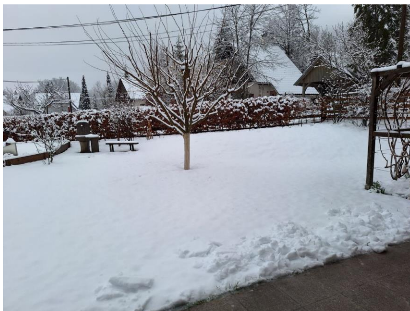
Zapadel je sneg...