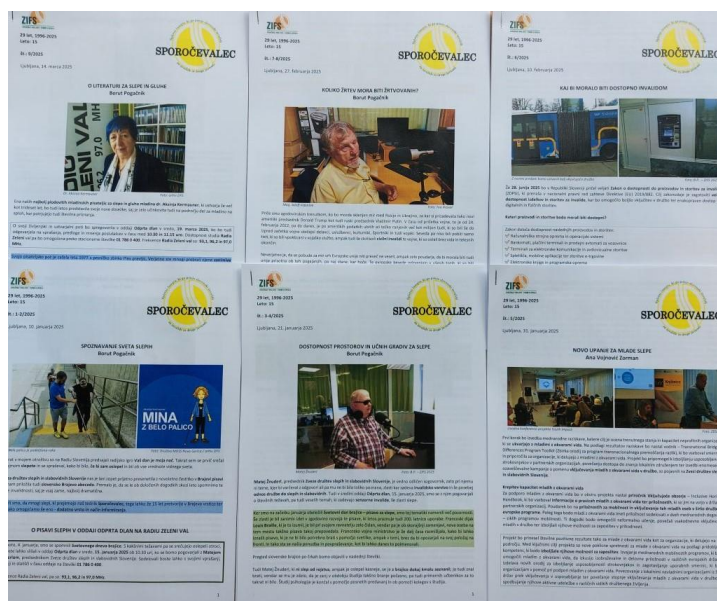
Časopis Sporočevalec se izdaja že od leta 2010 naprej

Tisk je za radiem in televizijo še vedno zelo pomemben. V dobi digitalizacije pa generacije 45+ še vedno bolj zaupajo in uporabljajo tradicionalne masovne medije, ker menijo, da so manj senzacionistični. Prava razlika pa so tisti med 18. in 34. letom, ki jim ni zelo mar za zanesljivost, saj preberejo tisto, na kar hitro naletijo, čeravno so to lahko lažna poročila oziroma novice (fake news). Medtem ko je rezultat povprašani glede pomembnosti novinarstva visok, pa jih ima zaupanje v medije samo še 41 odstotka, kar je podobno meritvam v EU, kjer je ta številka še za odstotek nižja. Tudi v Evropi je še vedno največ zaupanja v javno radio-televizijo in njihove online izvedbe, nato pa takoj sledi tisk.