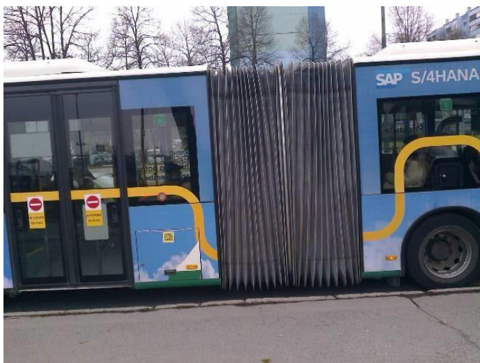
Z novimi predpisi bomo ustvarili bolj vključujočo družbo