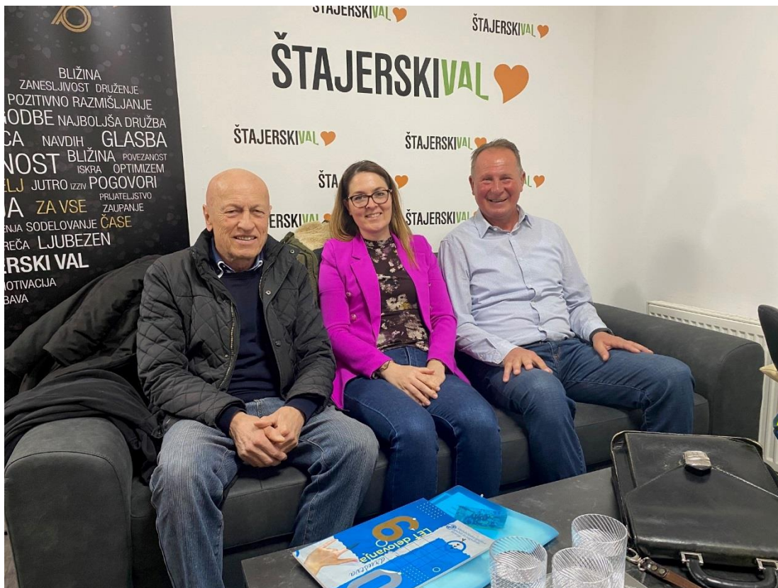
Gostovali smo na Štajerskem valu