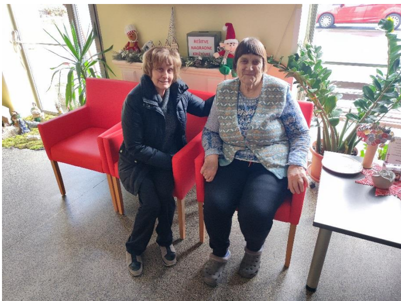
Druženje v Ormožu in Mengšu