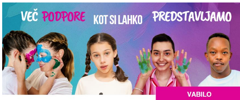
Več podpore kot si lahko predstavljamo