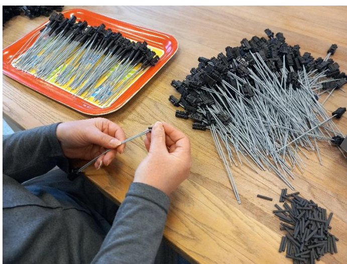
Zaposlitev pod posebnimi pogoji temelji na kooperantskih delih

Zaposlitev pod posebnimi pogoji v enoti ZU s pomočjo umetnosti izvajamo od leta 2005. Umetniško ustvarjanje temelji na konceptu Art brut umetnosti, ki ni podrejeno pravilom tehnike, klasičnim teorijam in trendom. Ustvarjalcem omogoča svobodno izražanje lastnega doživljanja, nudi jim osebno zadovoljstvo in potrditev. V keramični delavnici uporabniki ustvarjajo iz gline, učijo se novih tehnik oblikovanja, glaziranja, poslikave in okrasitev. V slikarski delavnici uporabniki spoznavajo različne slikarske tehnike, slikanja na platno, kartone, blago, grafiko, vezejo, itd. Njihovi izdelki so odraz njihovih osebnosti, notranje dinamike in medsebojnih različnosti, spontanega izražanja ter odnosa do ljudi in sveta, kot ga vidijo oni sami. Tovrstno umetniško izražanje pri naših uporabnikih »potegne« iz njih neslutene oblike. Omogočajo individualizacijo storitve. Upamo si trditi, da je bila naša enota v slovenskem prostoru drugačna in svojstvena. Razstavljali smo v domači galeriji in galerijah v širšem okolju, prodajali na stojnicah doma in na sejmih, se udeleževali umetniških bienalov v tujini in natečajev v Sloveniji in tujini ter dosegali visoka mesta. Bili smo prepoznani kot primer dobre prakse in sodelovali s predstavitvami na mednarodnih konferencah.