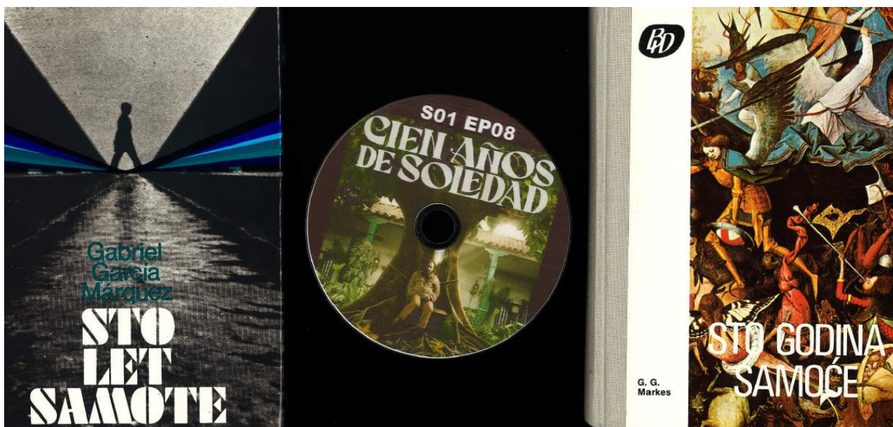
Sto let samote je na voljo na Netflixu od 11. decembra 2024