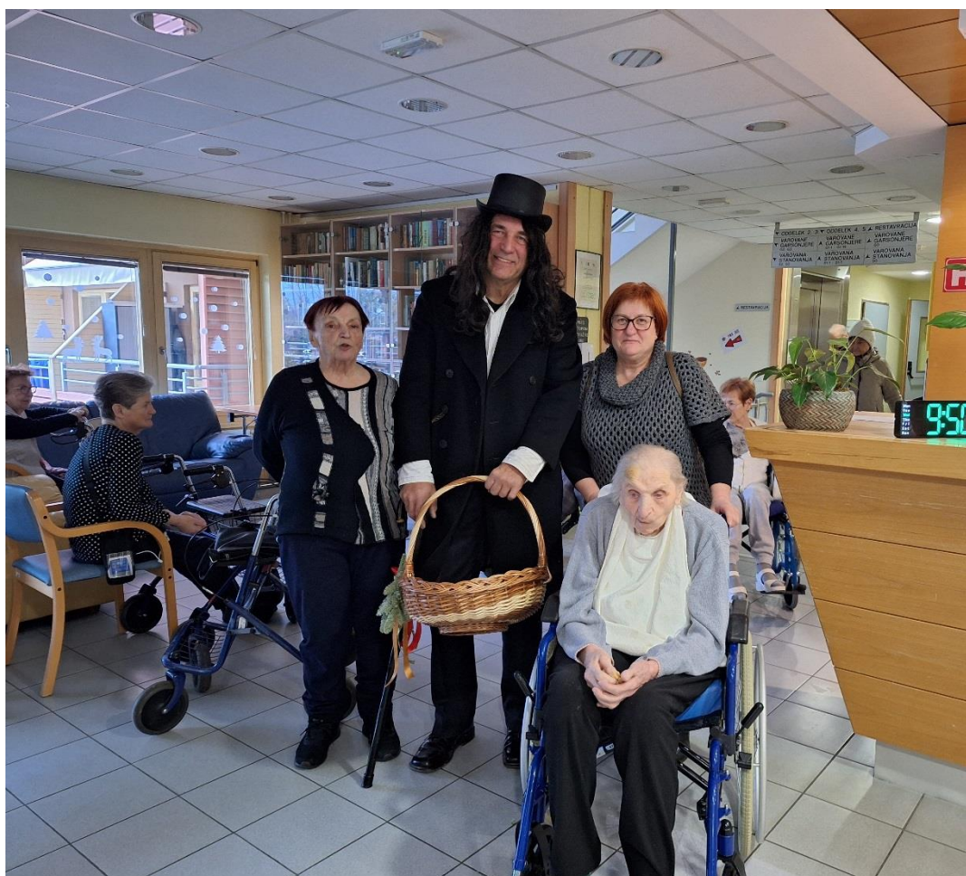
8. februar – Prešernov dan