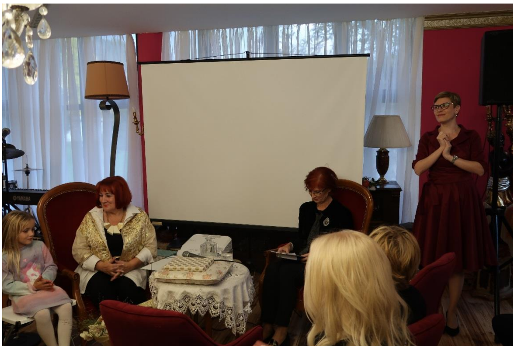
Nova knjiga Vlaste Nussdorfer je posvečena ljudem z gluhoslepoto