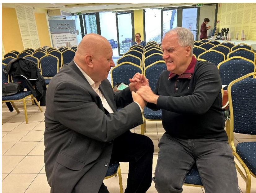
Obisk Zdrženja DLAN ob 30-letnici madžarske organizacije gluhoslepih