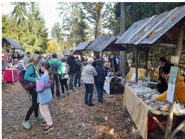
Nedeljsko druženje v Besnici