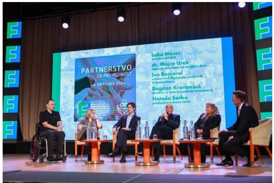
Gostje druge okrogle mize