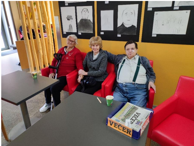
Druženje in branje časopisov v Ormožu