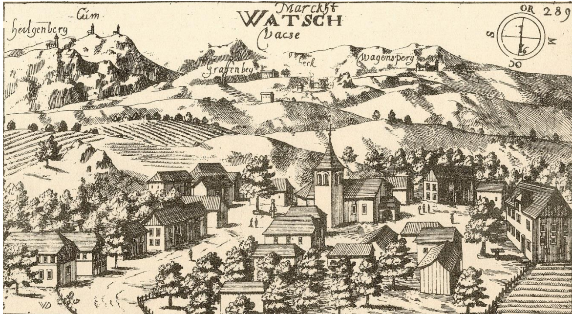
Trg Vače po Valvasorjevi Topografiji Kranjske (1679)