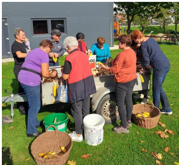
Trganje koruze in kožuhanje

Poleg tega, da je koruza bila in še je predvsem hrana za ljudi in živali, so v preteklosti zelo koristno uporabljali LIČJE – liste, ki so pokrivali koruzni storž kot surovino za izdelavo različnih uporabnih predmetov. Tako so spretno in vešče ženske tistega časa iz ličja pletle: predpražnike, cekarje, razne podstavke, različne uporabne košarice, copate-natikače..... in z ličjem so bile napolnjene tudi ležalne blazine ŠTROZOKI, ki se je vsaj enkrat na leto zamenjalo. Sicer pa je koruza povezana tudi z našim minulim šolstvom, saj so po pričevanju naših starih imeli v šolah koruzo na kateri so morali neubogljivi šolarji občasno klečati in še ena zanimivost za zvezo moškega in ženske, ki nista poročena, rečemo; da živita na koruzi.