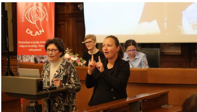
Posvet na temo starejših oseb z gluhoslepoto