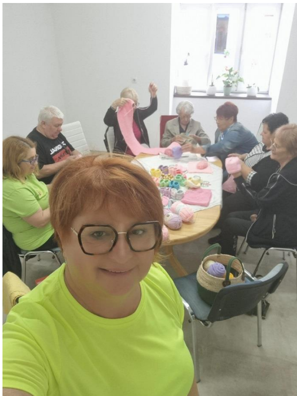
Utrinki iz delavnice