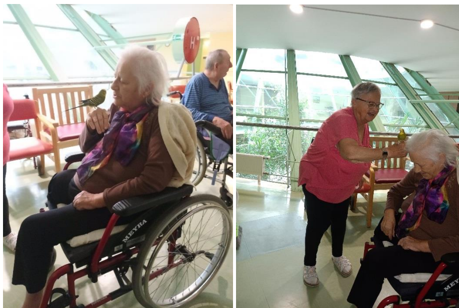
Družba za dobro jutro v Domžalah