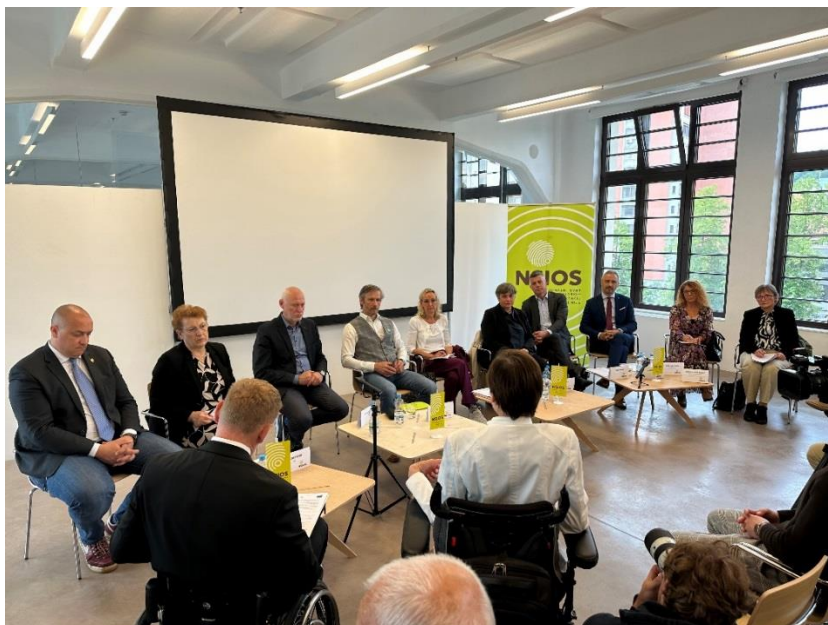
Srečanje s predstavniki političnih strank v prostorih Roga