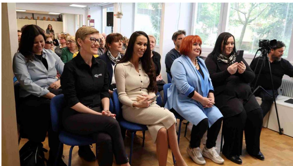
Številni častni gostje in podporniki Združenja DLAN