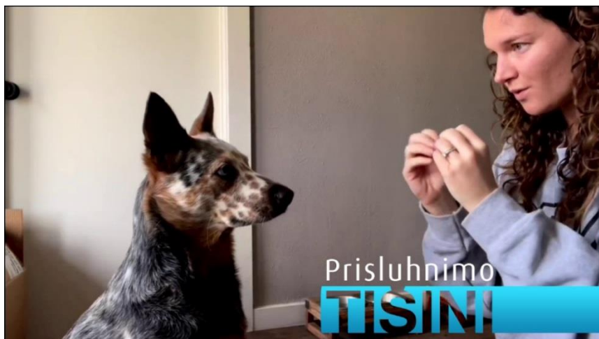
Foto: Prisluhnimo tišini