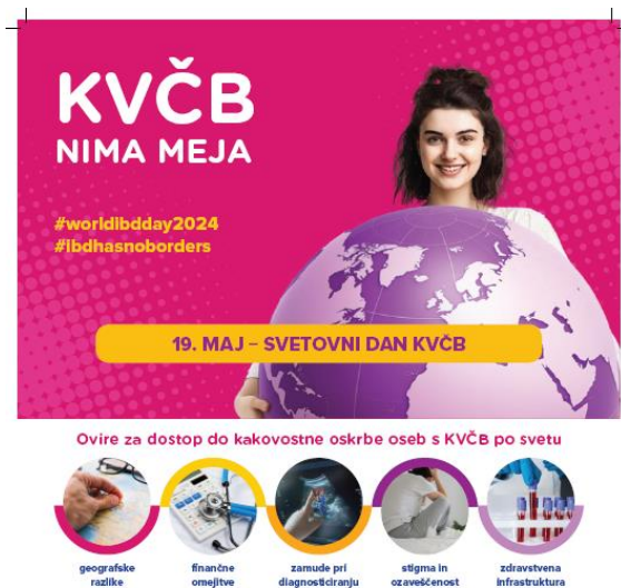
KVČB ne pozna meja