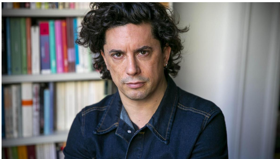
Založba Mladinska knjiga, strani 188, 27,99 eur Benjamin Labatut