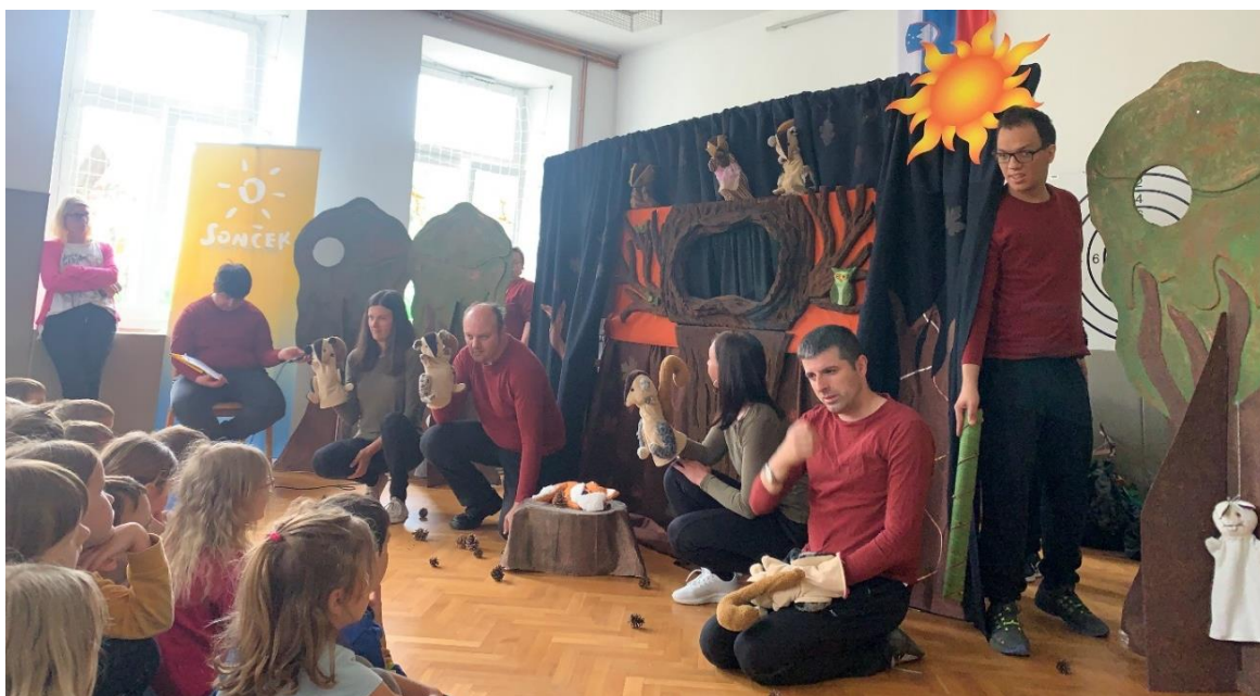
Sprejemanje drugačnosti z lutkovno predstavo Veveriček posebne sorte