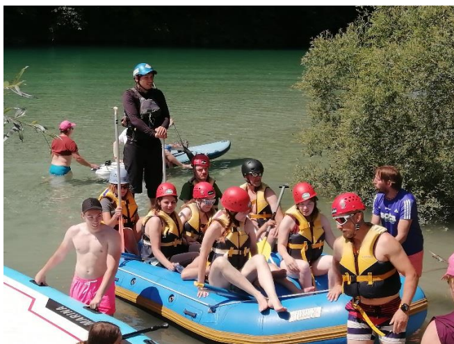
Sonček SG rafting