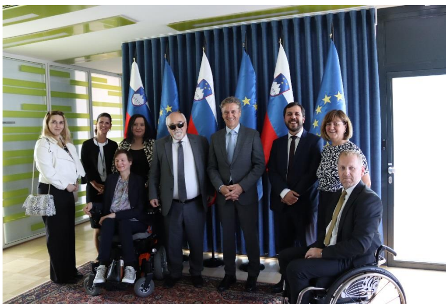
Ljubljana je gostila Generalno skupščino EDF