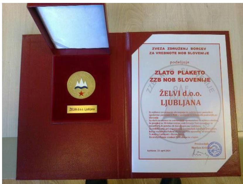
Prejeli so zlato plaketo

Na predlog Društva Zeleni prstan ZZB NOB Ljubljana je invalidsko podjetje Želva d.o.o. prejelo Zlato plaketo za zavzemanje pri ohranjanju in vzdrževanju pomnikov zgodovine povezane z NOB v Ljubljani in nekaterih področjih po Sloveniji. Podelitev je bila v četrtek, 25. aprila 2024, ob 83. obletnici ustanovitve Osvobodilne fronte Slovenskega naroda in državnem prazniku Dnevu upora proti okupatorju.