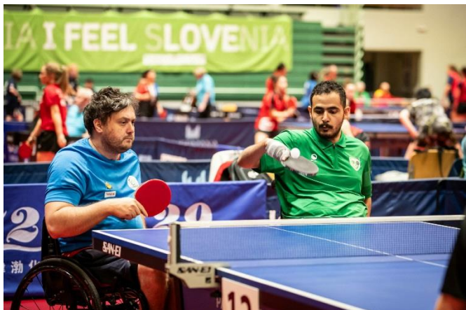
Največji namiznoteniški turnir na svetu za parašportnike