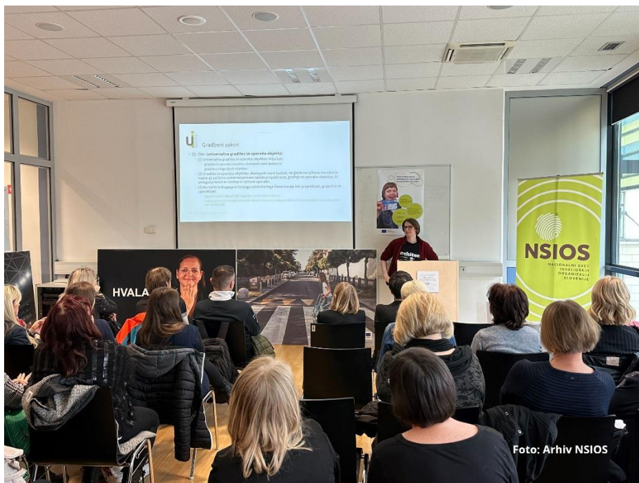
Zaposleni na UE se vsakodnevno srečujejo z invalidi