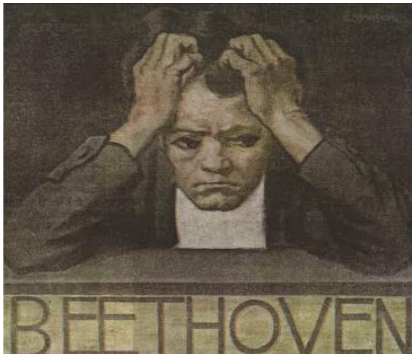
Beethovnovno depresivno razpoloženje razodeva tudi slika neznanega avtorja