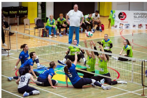
Turnir Zlate liga narodov