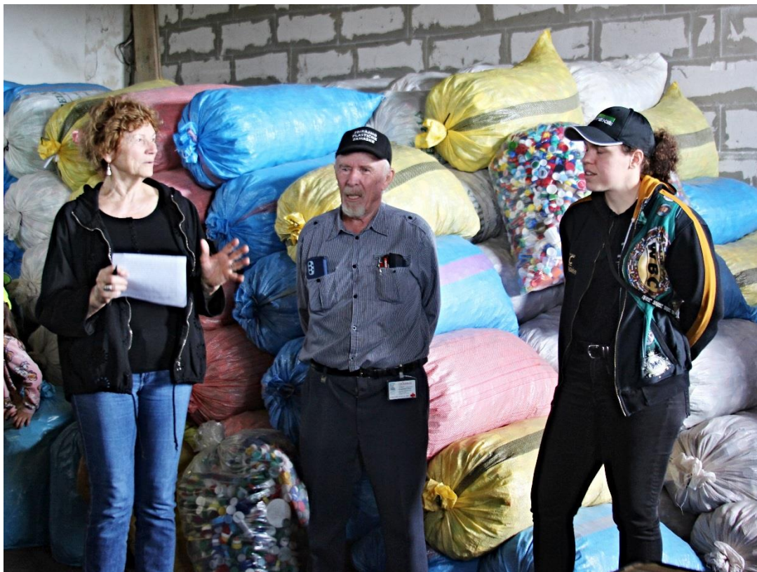
Humanitarni projekt zbiranja plastičnih zamaškov