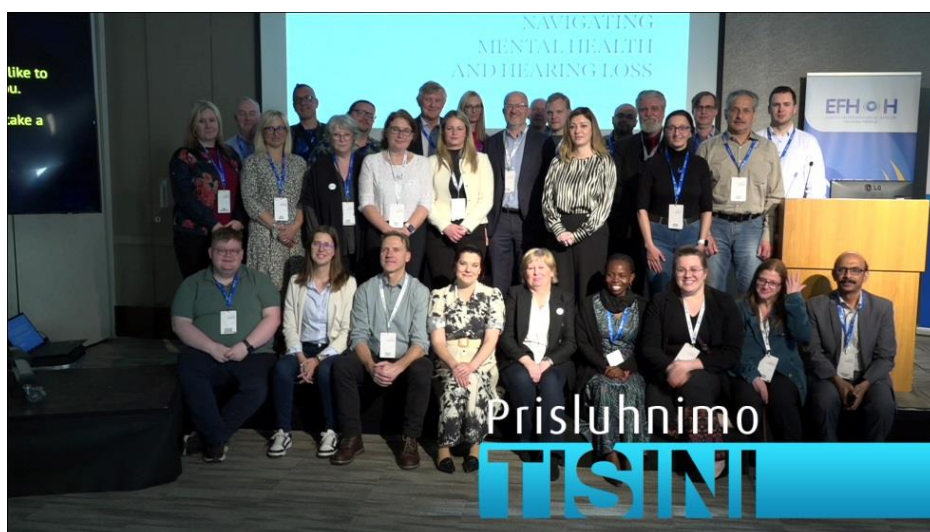
Foto: Prislusnimo tišini

Konec aprila je Zveza društev gluhih in naglušnih Slovenije v Ljubljani pripravila mednarodno konferenco Poti do duševnega zdravja ob izgubi sluha , ki je združila tako domače kot tuje strokovnjake s tega področja. Med drugim so