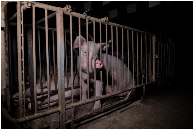
Svinja v pripustišču na slovenski farmi