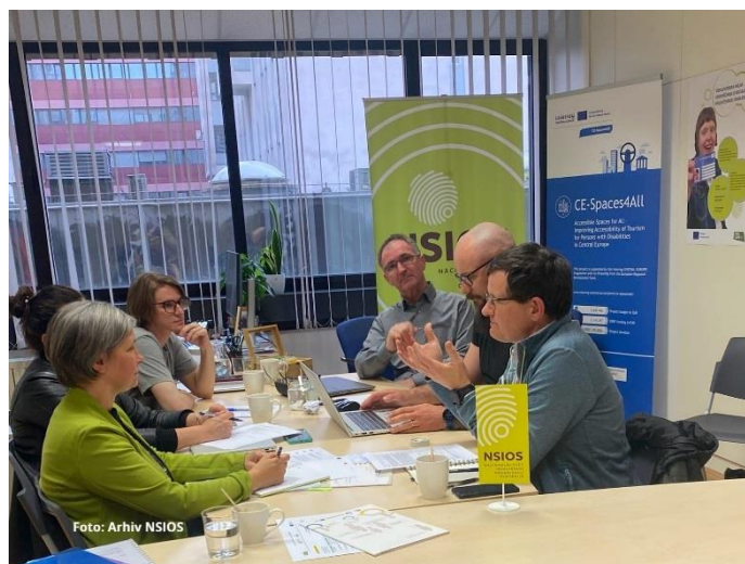
Seja delovne skupine