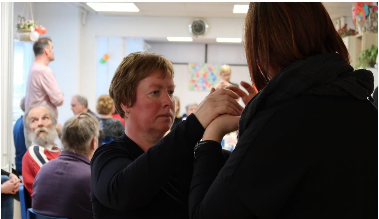
Prejemanje informacij izključno preko dotika