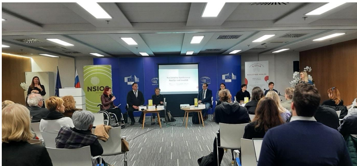
Nacionalna konferenca Nasilje nad invalidi