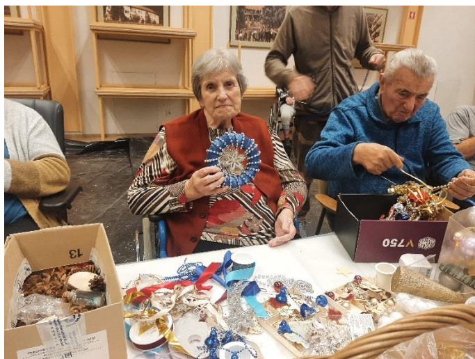
Z uporabniki programa Veriga na Jesenicah