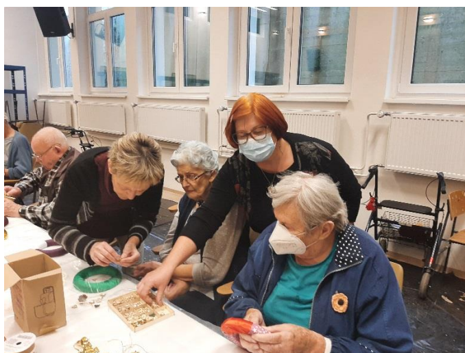
Skupaj smo izdelali adventne venčke