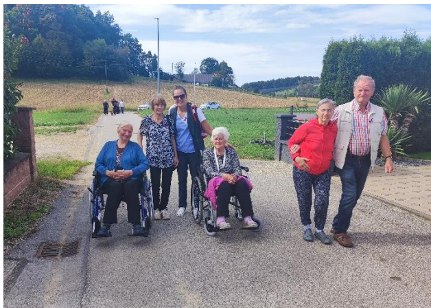
Druženje z uporabniki programa Veriga v Juršincih in na Jesenicah