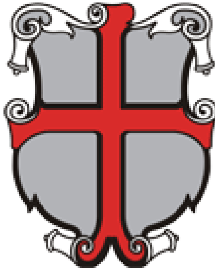
Grb mesta Ptuj