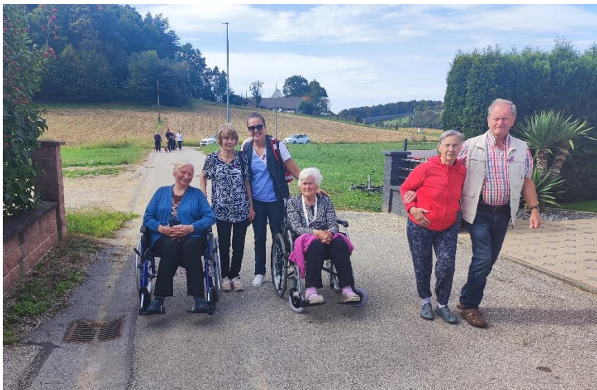
Na dopoldanskem sprehodu