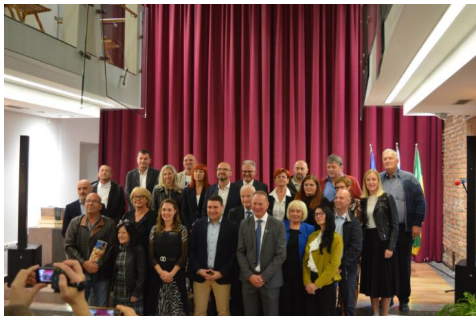
Župan MOV sprejel predsednike in strokovne delavce društev