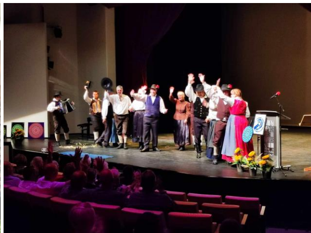
Tudi gluhi plešejo