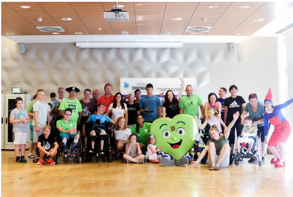
Udeleženci 5. Paralimpijskega tabora za družine