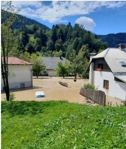
Črna na Koroškem