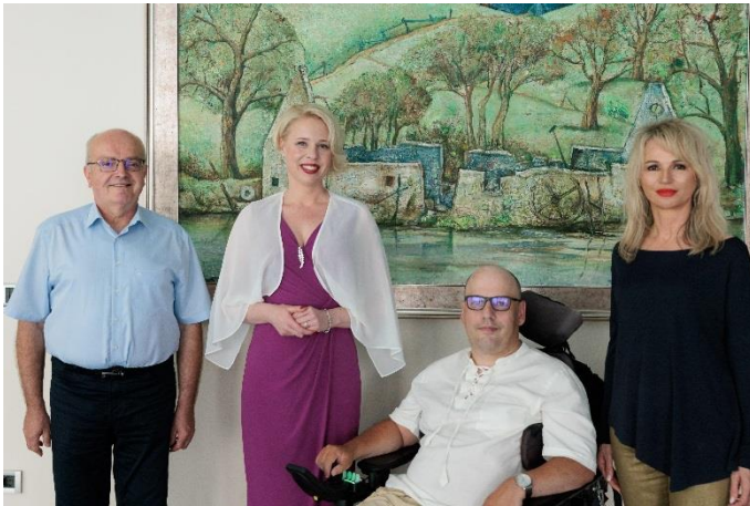
Srečanje s predsednico DZ mag. Urško Klakočar Zupančič