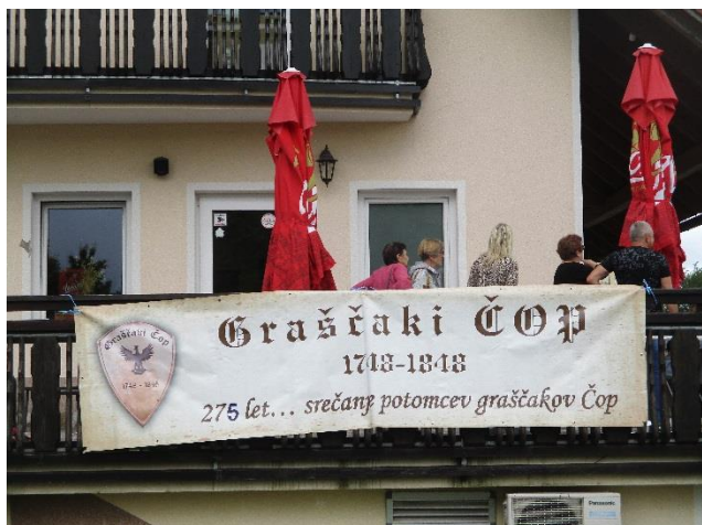
Dva utrinka s srečanja potomcev graščakov Čopov 11. junija 2023