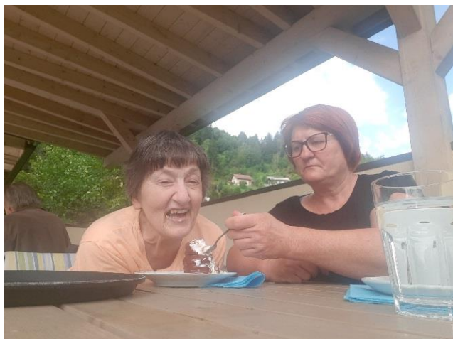
Čokoladno obarvan dan na Jesenicah