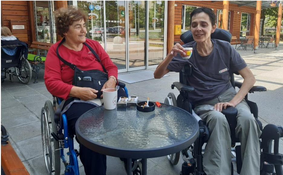
Druženje na Fužinah