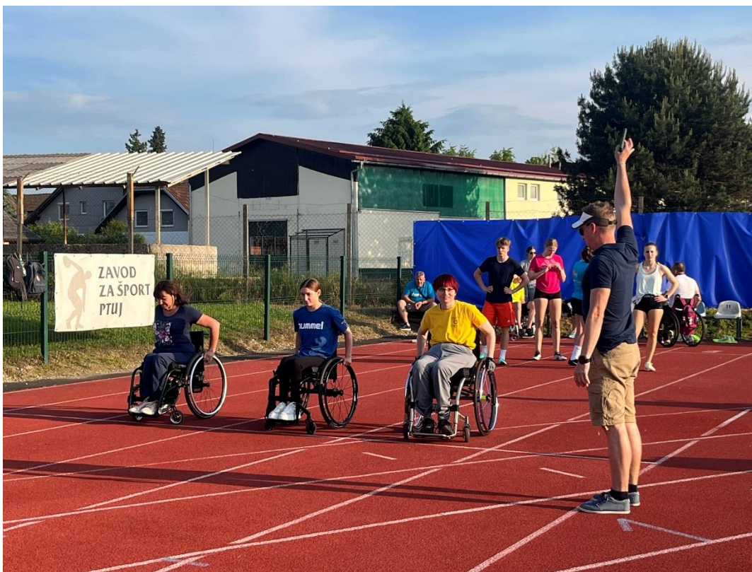
Štart tekmovalk na 100 metrov