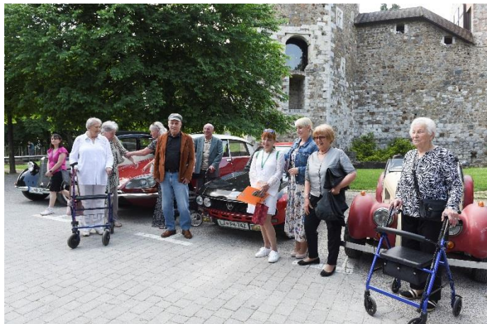
Pomladne iskrice na krilih zimzelenih melodij 2023 na Ljubljanskem gradu

na mlajše generacije. S tem želimo krepiti humano družbo, v kateri je vsak deležen spoštljivega odnosa, sprejetosti, dostojanstva.