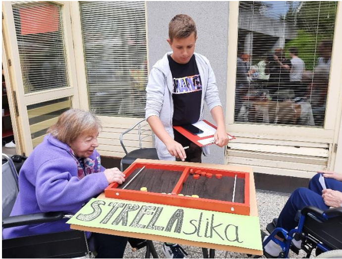
Zabavna igra strelastika