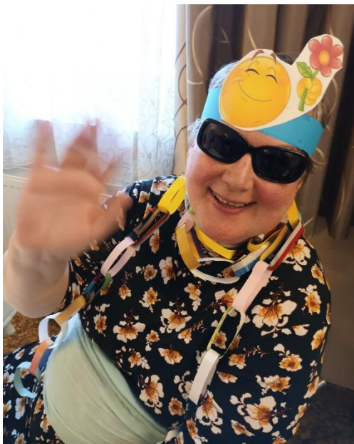
Mengeš je bil pustno obarvan