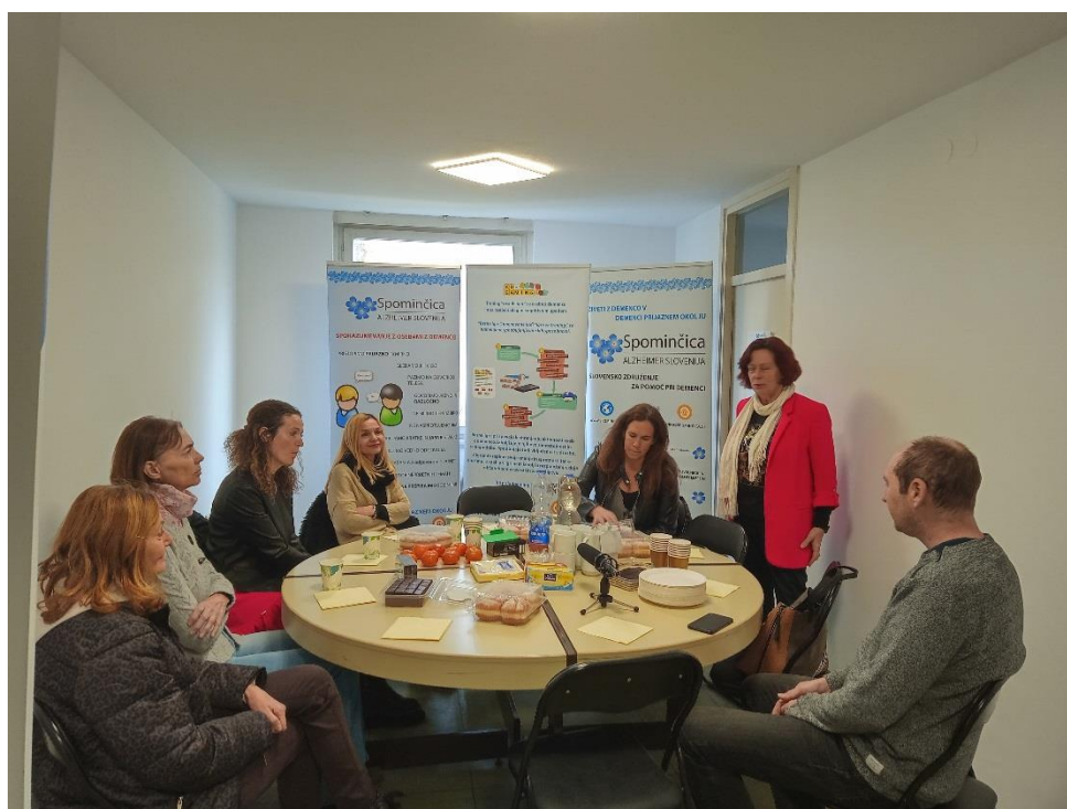
Novi prostori na Podgornikovi 3 v Ljubljani