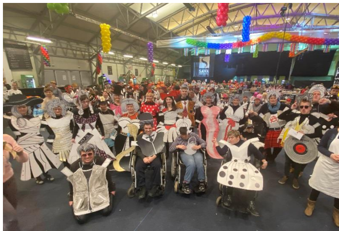
Pust VDC Ptuj