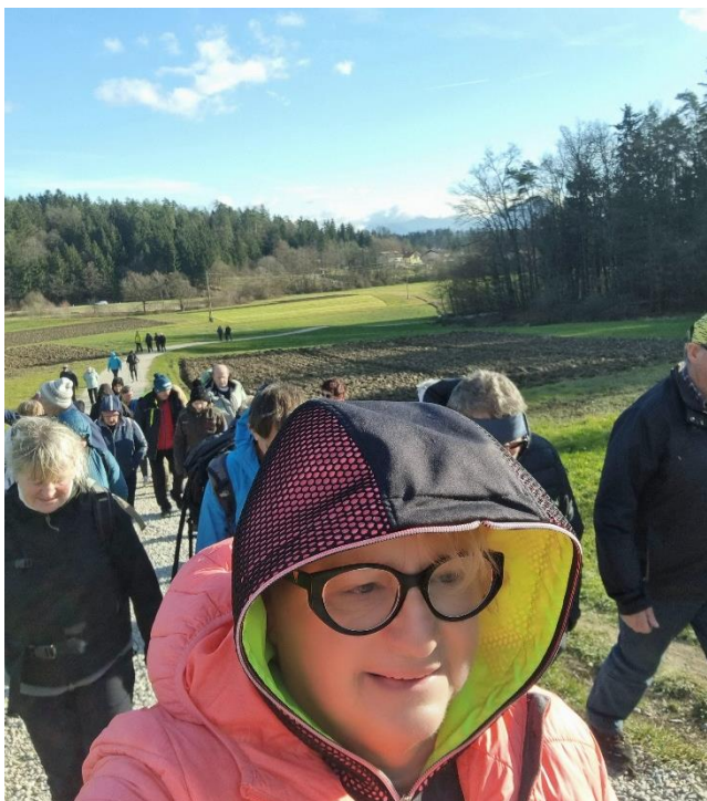
Na pohodu in praznovanju