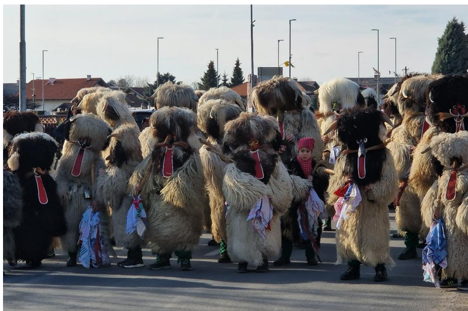
Fašenk na Vidmu