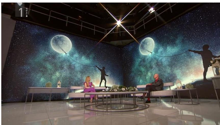
Sobotno popoldne (25.2.2023)