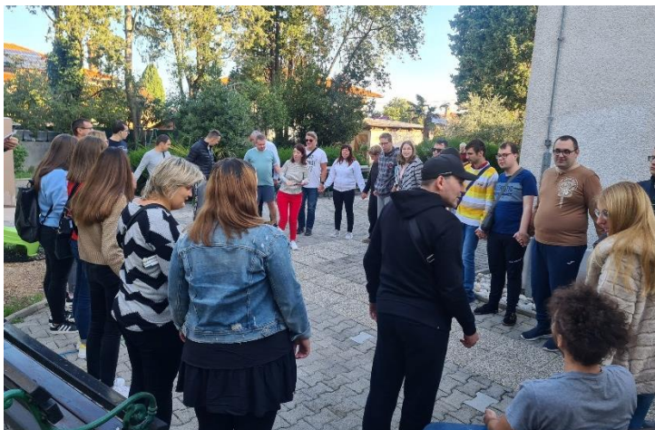
Utrinek z dogodka