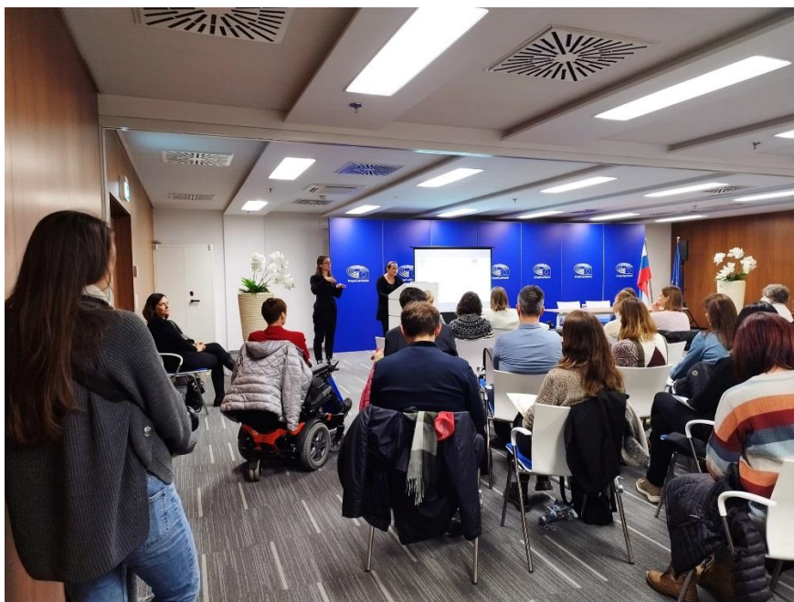
Utrinek z dogodka