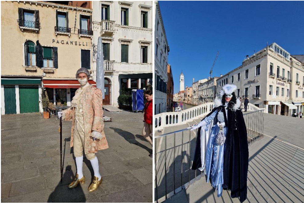
Utrinki iz Benetk