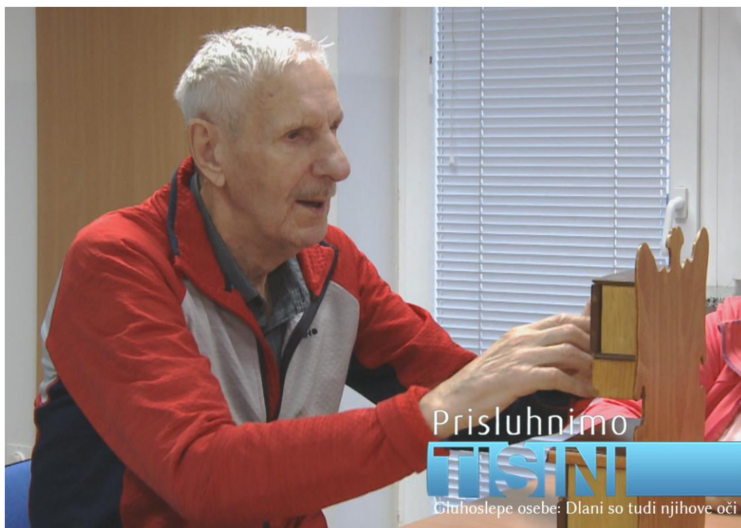
Foto: Prisluhnimo tišini