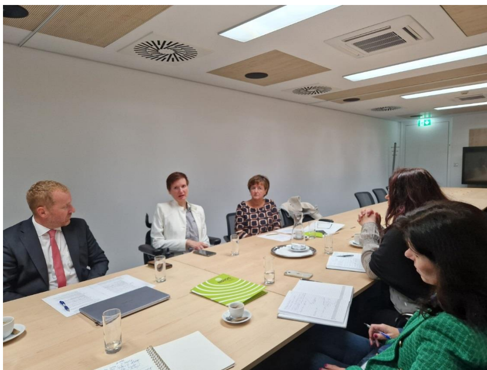
Fokalna skupina (28.10.2022)