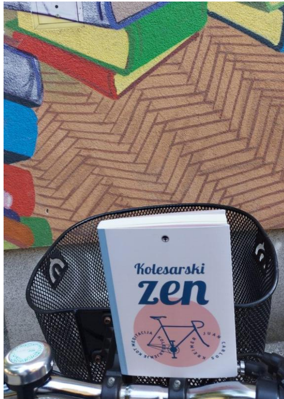
Založba Primus, 24 eur