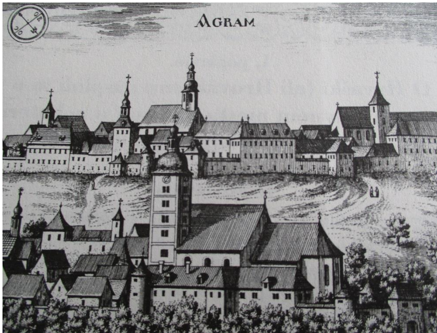
Zagreb v XII. knjigi Slave vojvodine Kranjske (1689)