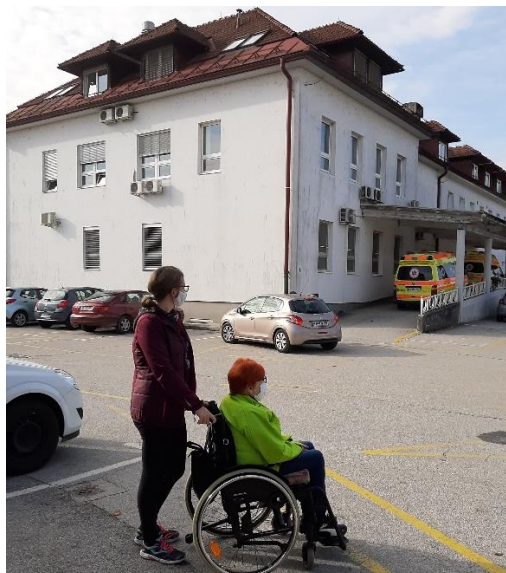
Me bodo sprejeli?