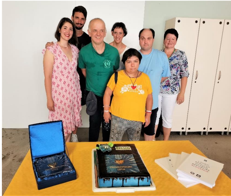
Prijetno druženje s koščkom sladke torte