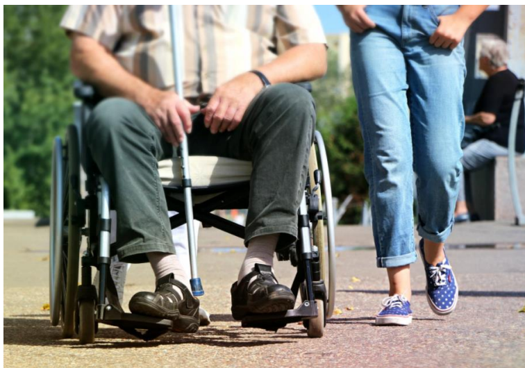
3. december »Nekatere invalidnosti niso vidne«