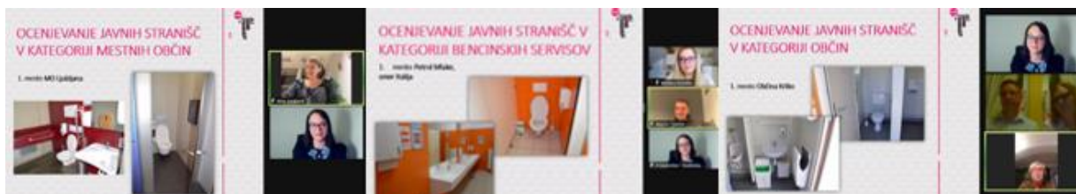
Naj javno stranišče 2020: MO Ljubljana, Bencinski servis Petrol Mlake, smer Italija, in Občina Krško