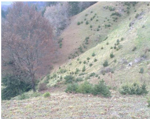
Ko misli drsijo vse globlje...