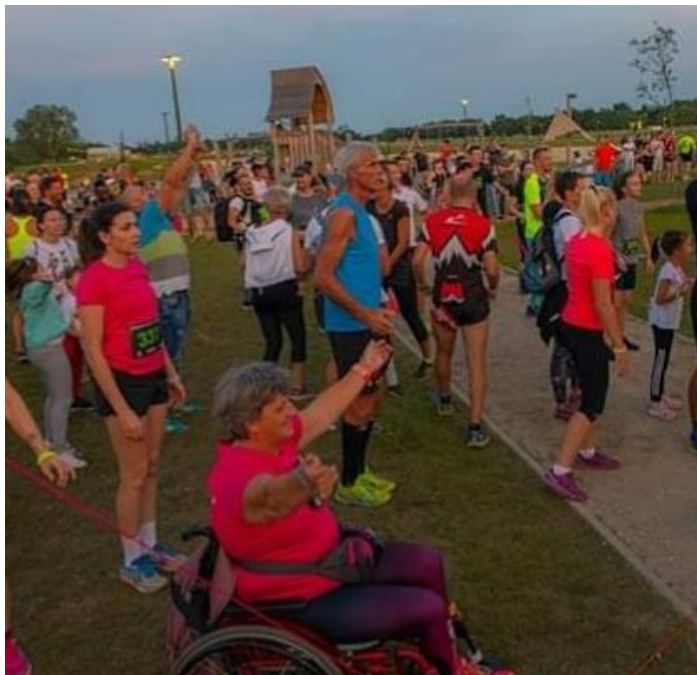
Ogrevanje tekačev pred samim tekom

jezeru. V Murski Soboti se je zbralo 300 tekačev, ki so tekli na 4.35 km in 8.7. km razdalji ob jezeru. Kot vidite, je zadovoljna in nasmejana prišla na cilj.