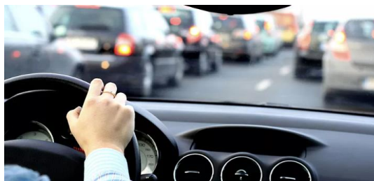
Pot na delo