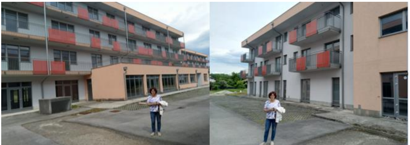
Že več kot 10 let stoji nedokončan dom v Vrtojbi