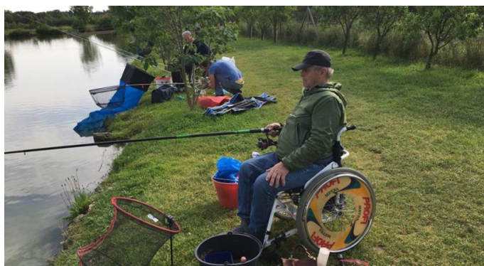
Začela se je ribolovna sezona