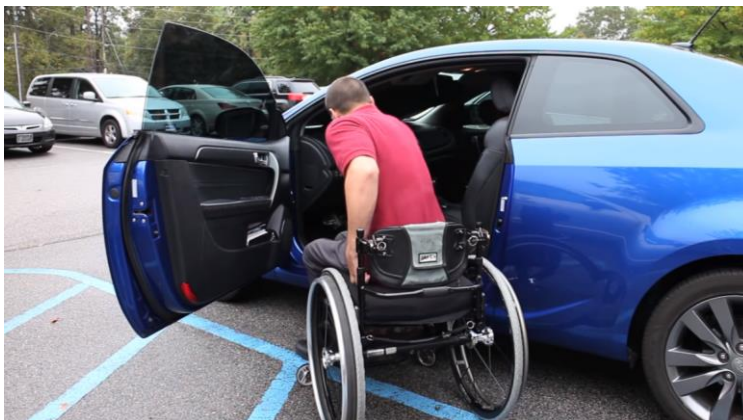
Oprostitev plačila DMV