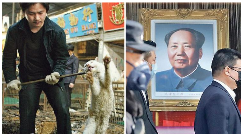
Vir: Jutarnji list, 14.3.2020

V sobotni izdaji hrvaškega osrednjega časnika Jutarnji list, to soboto, 14. marca, sta izšla dva zanimiva članka o koronavirusu z naslovom »Virus moramo ustaviti čimprej« in pa »Bilo je usojeno da pride virus s Kitajske«. Predvsem drugi članek je izjemno zanimiv, saj sicer levi hrvaški časnik zelo ostro ocenjuje razmere v današnji Kitajski, kar zadeva vzgojo in prodajo divjih živali, saj v podnaslovu celo piše: »Glavni krivec je Mao Ce-tung in njegova kulturna revolucija 70-ih«.