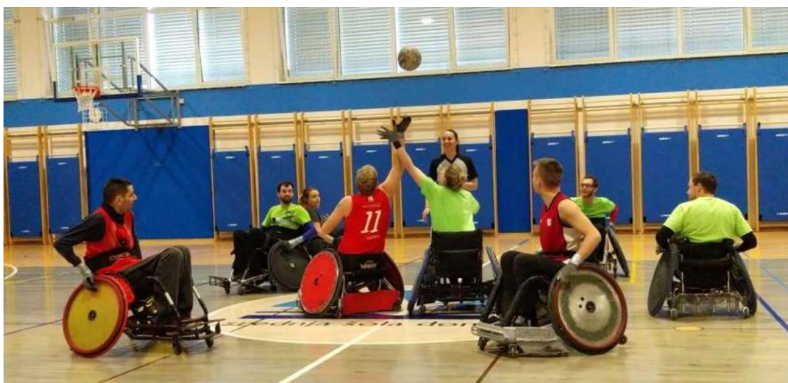
Rugby je zelo razvita športna disciplina