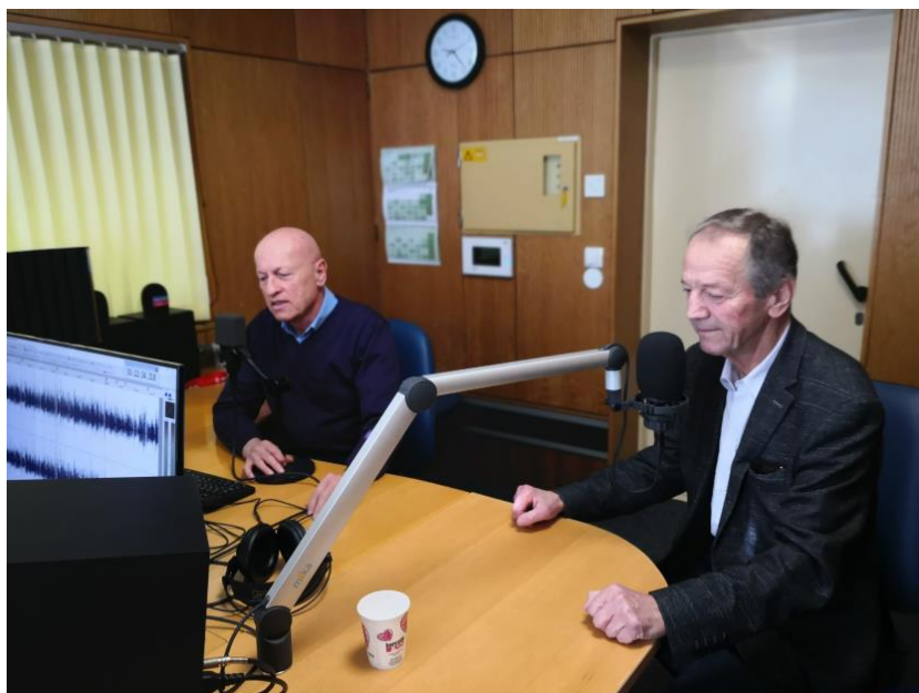
Z radijskimi oddajami seznanjamo javnost