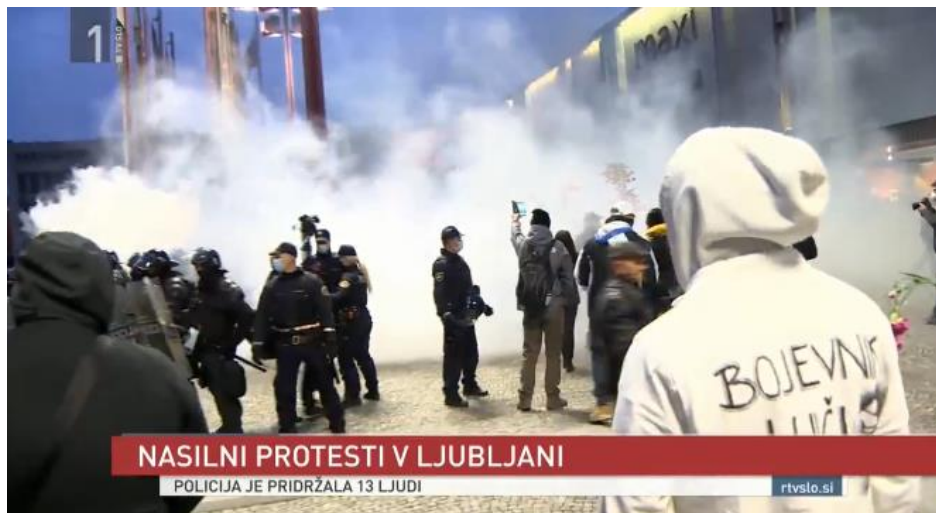
Nasilni četrtkov protest v Ljubljani (5.11.2020)