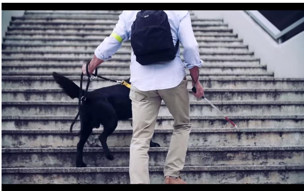
Pes vodnik, ki hodi ob slepi osebi